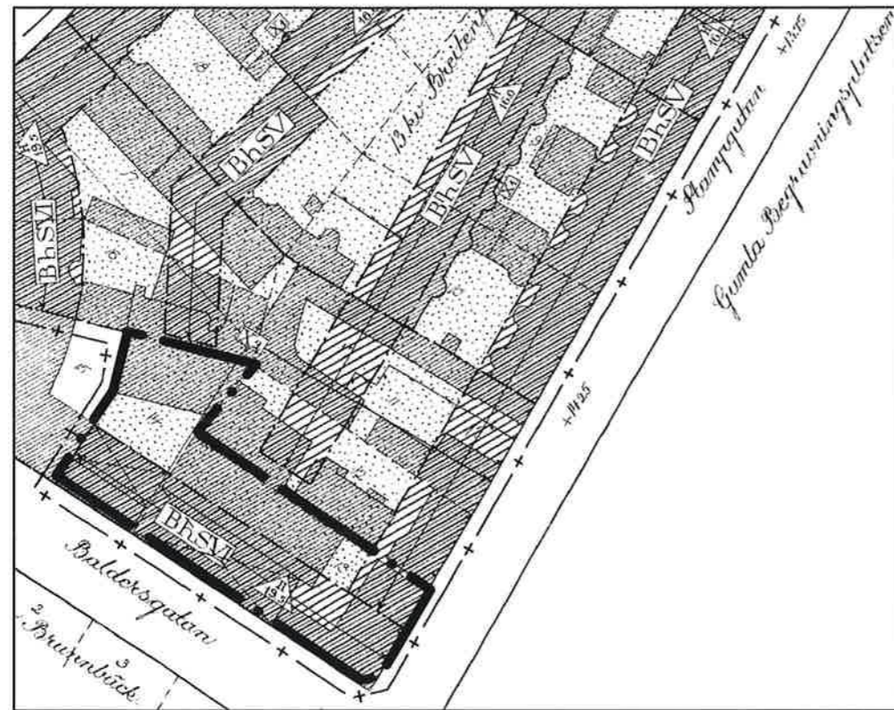
Del av gällande detaljplan F2183