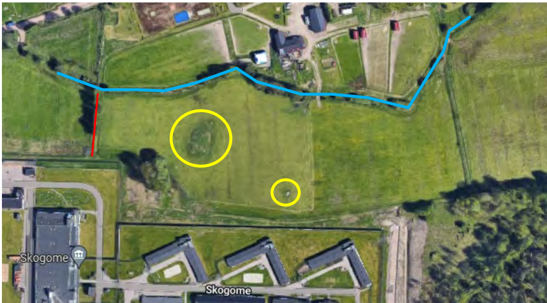
Natur- och kulturhistoriskt intressanta värden. Blå linje indikerar Skogomebäcken, röd linje indikerar trädallén och gula cirklar markerar åkerholmar.

Aktuell jordbruksmark hyser kulturhistoriskt intressanta värden. Skogomebäcken avgränsar området mot det fortsatta jordbrukslandskapet i norr och bäckens form är troligen ett resultat av dikning. På marken finns även två åkerholmar och i områdets västra gräns finns en trädallé, vilka alla är objekt som klarlagts som biotopskyddade i naturvärdesinventering. Jordbruksmarken kan sägas vara en pusselbit i att läsa av landskapet kring Skogome. Det kan dock sägas att kriminalvårdsanstalten redan idag påverkar upplevelsen av det historiska jordbrukslandskapet och Skogomebäcken samt trädallén kommer fortsatt att kunna utgöra naturliga avgränsningar i landskapet vid en utökning av anstaltsområdet. Själva ingreppet av ett utökat anstaltsområde anses därmed ha låg påverkan på jordbruksmarkens natur- och kulturvärden.