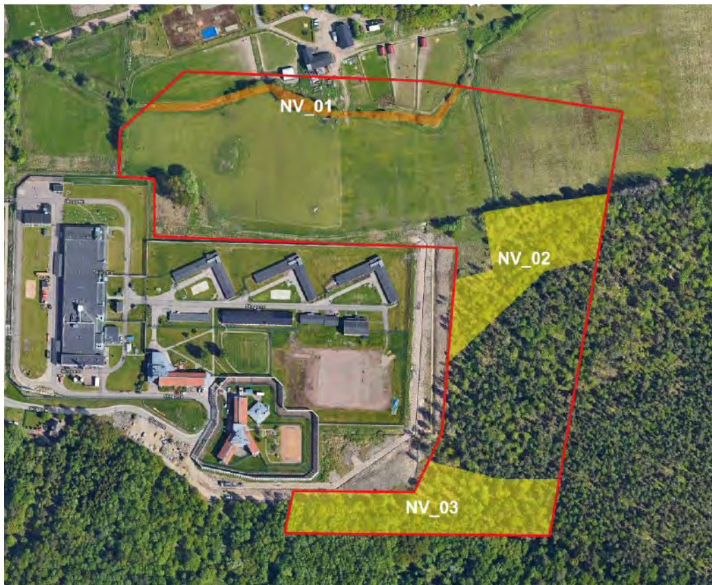
Naturvärdesobjekt enligt Naturvärdesinventering. Orange visar klass 3 och gult visar klass 4.

Området öster om anstalten består till största del av skogsmark med kuperad mark som stiger österut, med påtagliga höjdskillnader. Enligt en Naturvärdesinventering utförd av Tyréns, 2022 finns det kända naturvärden i området med klassningen 4 – visst naturvärde, i form av medelålders flerskiktad trivallövskog med inslag av död ved. Skogomeanstalten har skapat flera högstubbar i området för att flytta dit den rödlistade arten mindre hackspett, som nu finns i området.