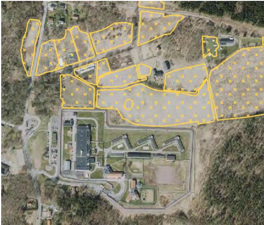
Kartbild över areella näringar i översiktsplanen. Gula, kryssade områden anger jordbruksmark.