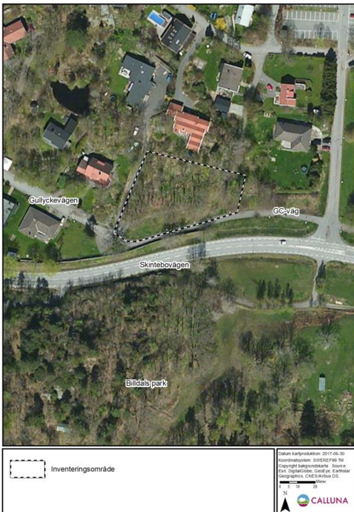
Figur 1. Inventeringsområdets geografiska placering i Billdal söder om Göteborg.