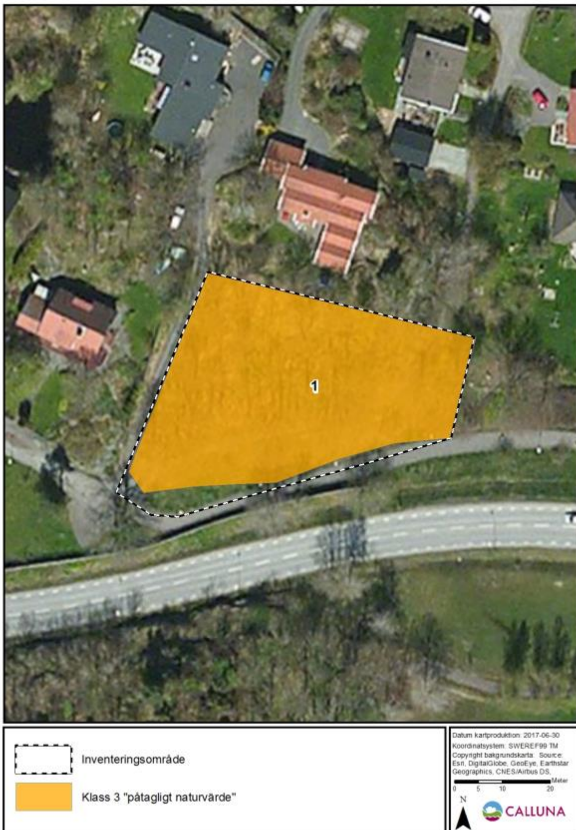
Figur 2. Kartan visar resultatet från Callunas naturvärdesinventering, där ett naturvärdesobjekt identifierades. Observera att inget naturvärdesobjekt har klassats som naturvärdesklass 1 - högsta naturvärde eller naturvärdesklass 2 – högt naturvärde.