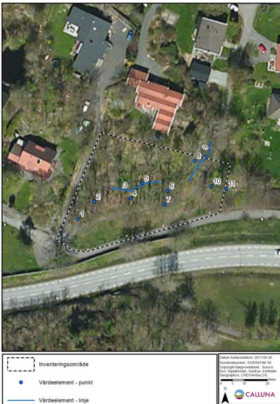
Figur 3. Kartan visar lokaliseringen av de registrerade värdeelementen vid Gullyckevägen.