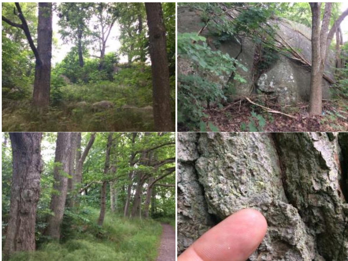
Ett urval av bilder från området. Nederst till höger syns ett litet exemplar av rostfläck vid fingerspetsen.

Områden som bedömts ha lågt naturvärde är en klippt gräsmark utmed GC-väg i söder delen av inventeringsområdet.