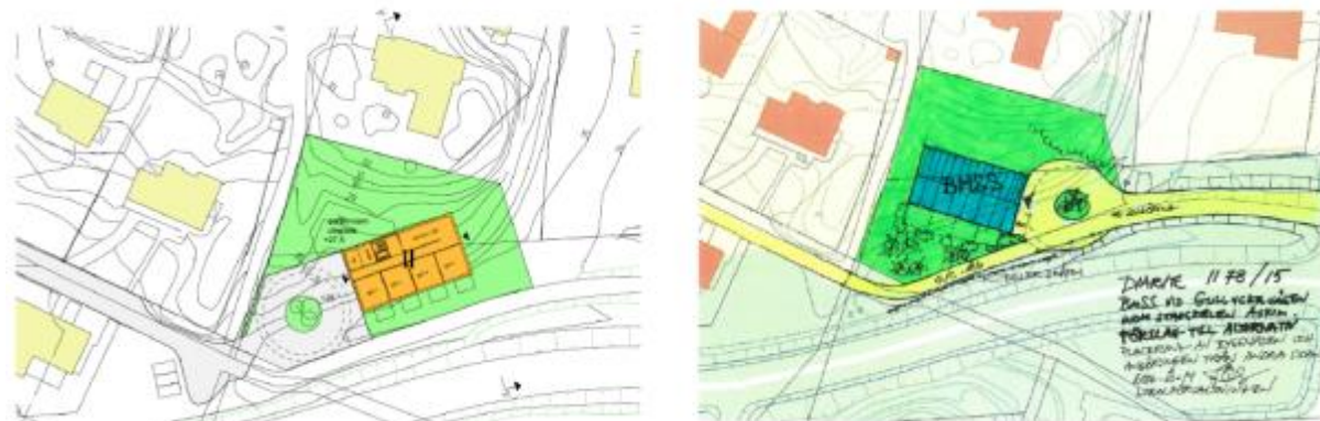
Figur 4. Illustrationer på de två nuvarande alternativ för byggnation.

I planarbetet finns det i dag två olika alternativ för byggnation (Fig. 4). De huvudsakliga skillnader är vilken infart man rekommenderar till boendet samt själva placeringen av boendet.