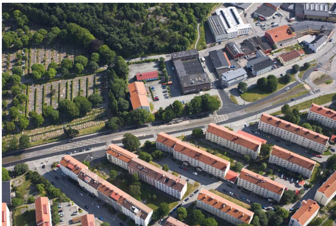
Flygfoto från norr över planområdet och dess omgivning.

Detaljplanen syftar även till att ge stöd i detaljplanen till det befintliga studentboende som finns inom detaljplaneområdet. Detaljplanen möjliggör en komplettering med bostadsbebyggelse i ett attraktivt läge i Göteborg med närhet till kollektivtrafik, service och naturområden. Ny bebyggelse ska anpassas till omgivningen i skala och form.