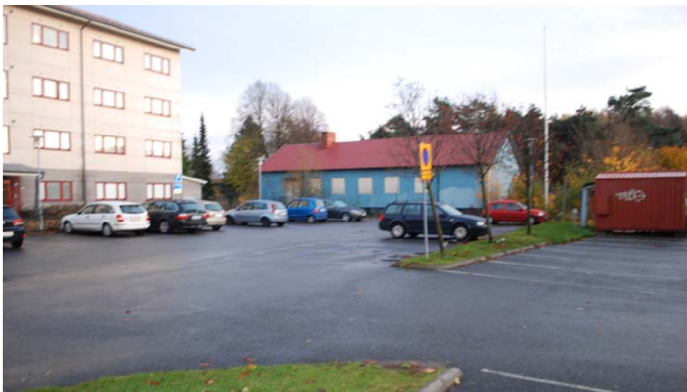
Bild på planområdet från hösten 2011. Den blå byggnaden är den gamla hemvärnsgården som nu är riven. Byggnaden till vänster är det befintliga studentboendet.

Genomförandetiden är fem år från det datum då planen vunnit laga kraft.