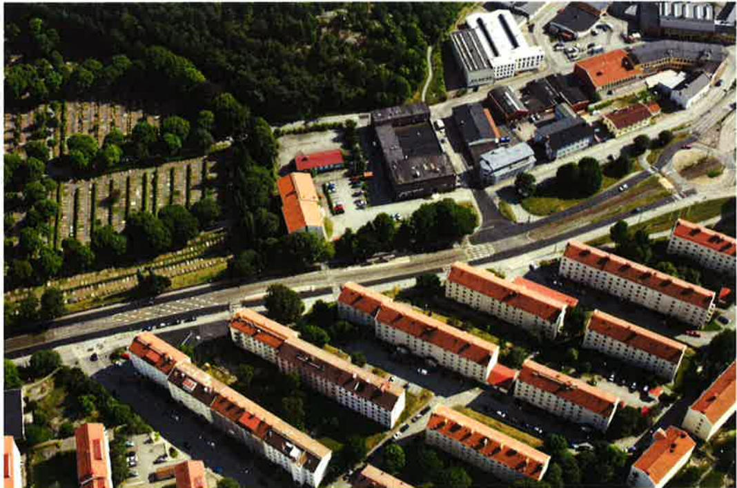
Flygfoto från norr över planområdet och dess omgivning.

Detaljplanen syftar även till att ge stöd i detaljplanen till det befintliga studentboende som finns inom detaljplaneområdet. Detaljplanen möjliggör en komplettering med bostadsbebyggelse i ett attraktivt läge i Göteborg med närhet till kollektivtrafik, service och naturområden. Ny bebyggelse ska anpassas till omgivningen i skala och form.