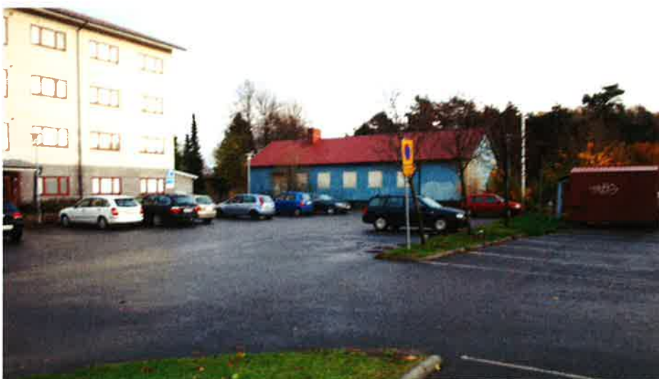
Bild på planområdet från hösten 2011. Den blå byggnaden är den gamla hemvärnsgården som nu är riven. Byggnaden till vänster är det befintliga studentboendet.

Nollalternativet innebär även att det befintliga studentboendet inte skulle få stöd i detaljplan och således vara tvunget att rivas.