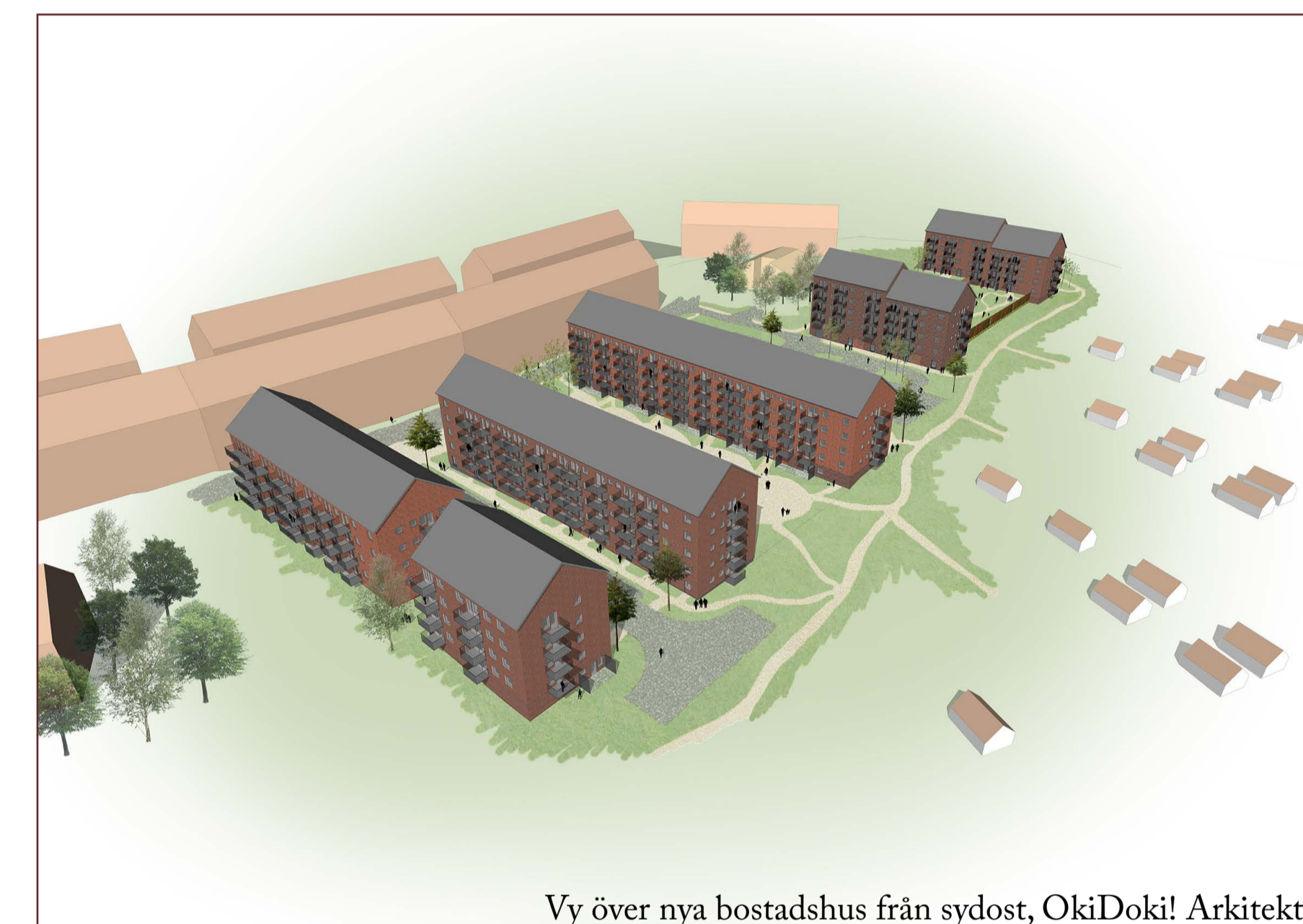
Vy över nya bostadshus från sydost, OkiDoki! Arkitekter