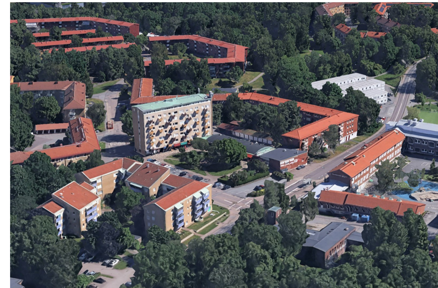
Befintligt utseende av bebyggelse.