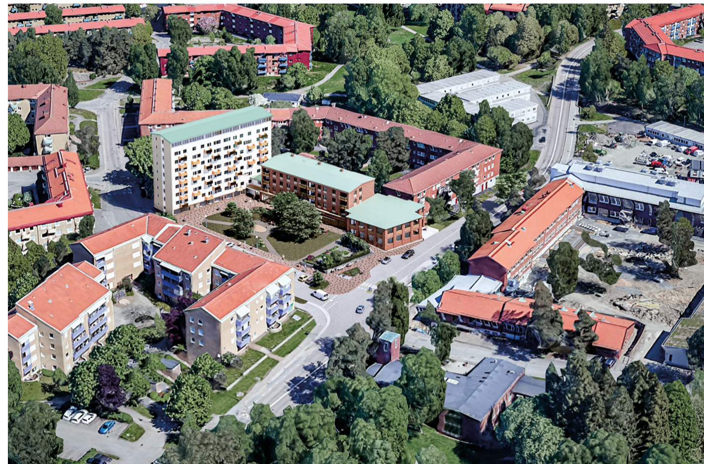
Vy från sydväst med föreslagen bebyggelse. Visionsbild: Ferrum arkitekter