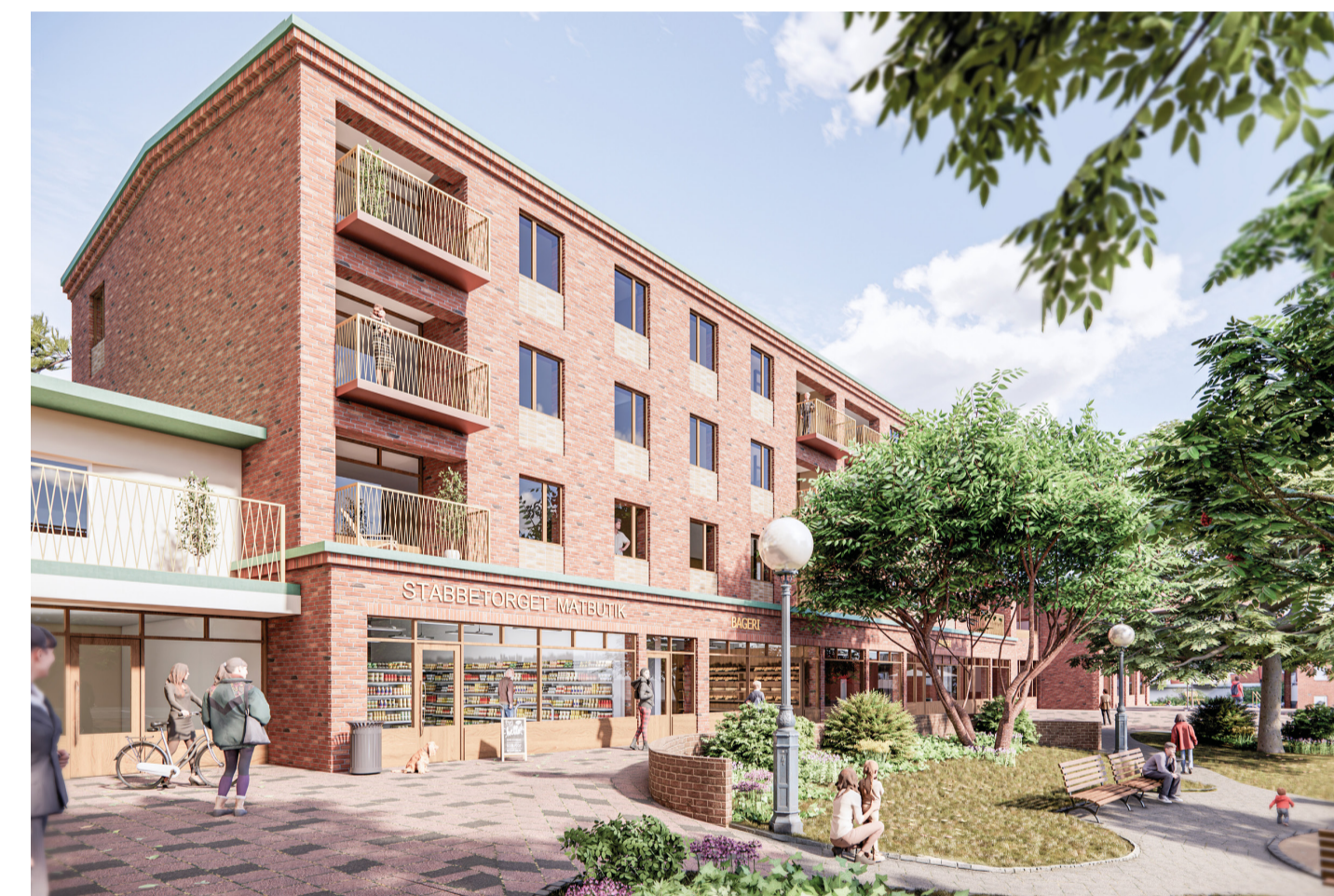
Perspektiv från torget. Visionsbild: Ferrum arkitekter