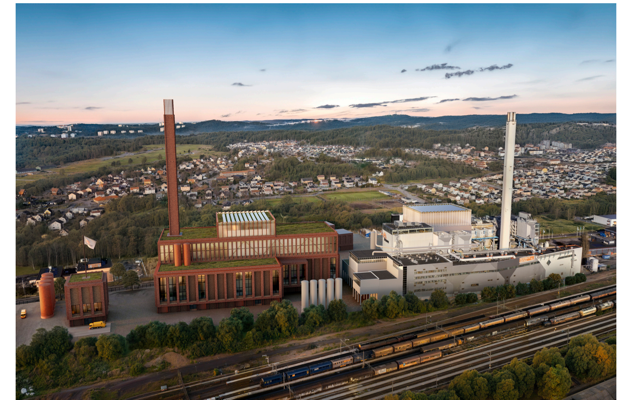
Illustrationsbild ovan: Liljewall Vybild till vänster: Göteborgs Stad