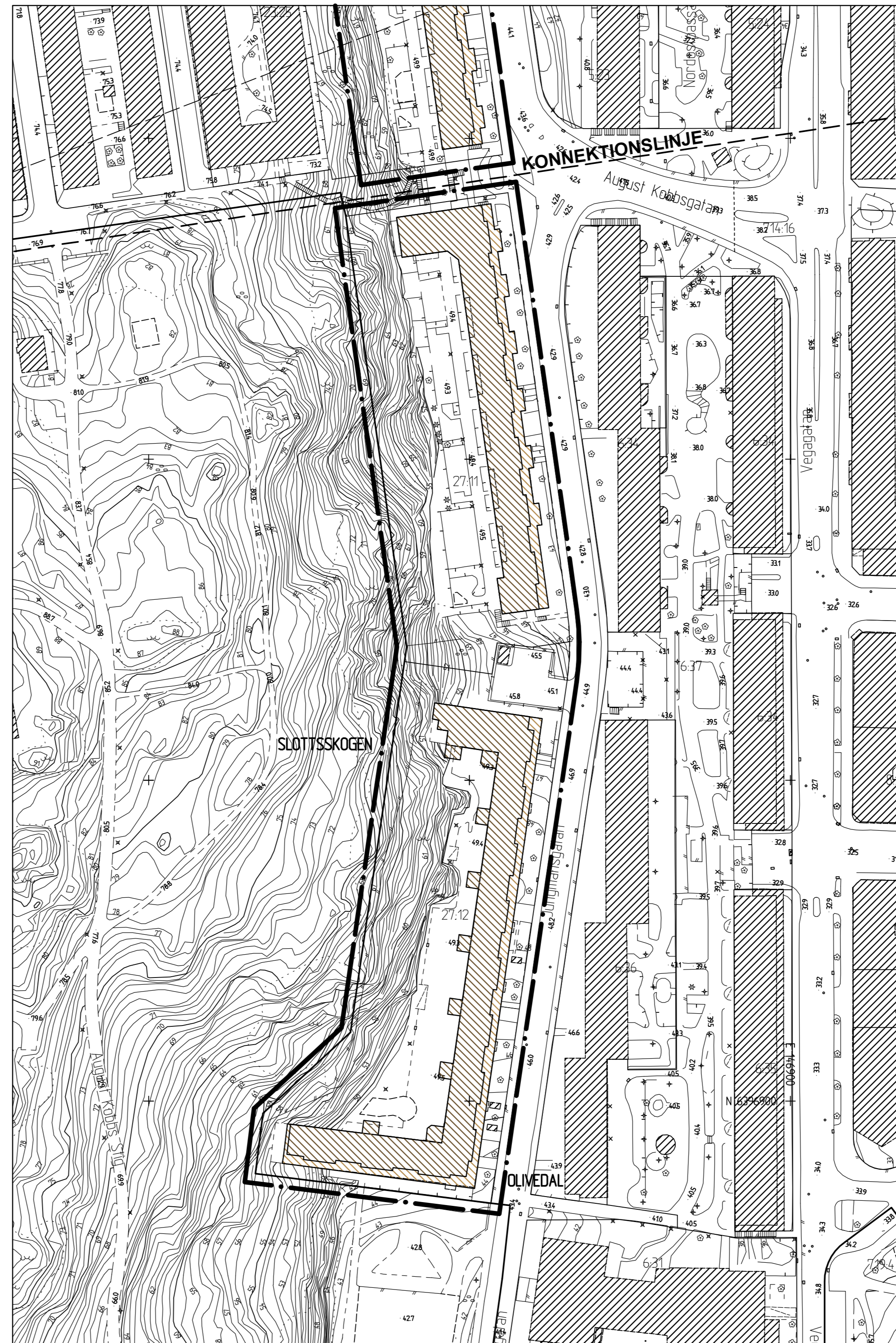
ILLUSTRATION del 2, södra delen