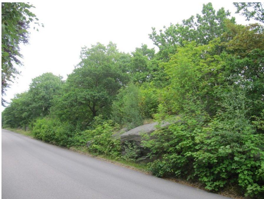
Bild 1. Programområdets södra del från Ulfsparrégatan.