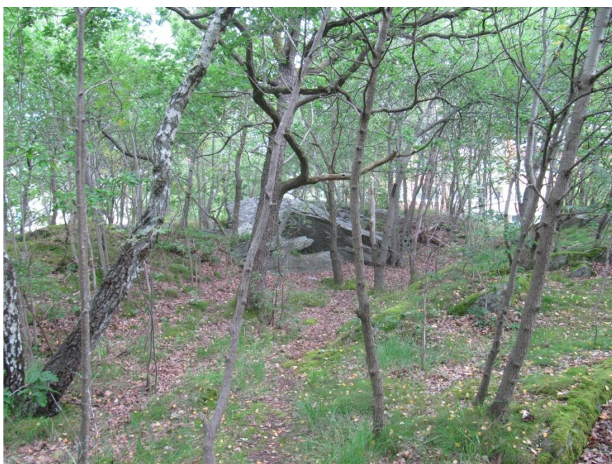
Bild 2. Programområdets norra del.