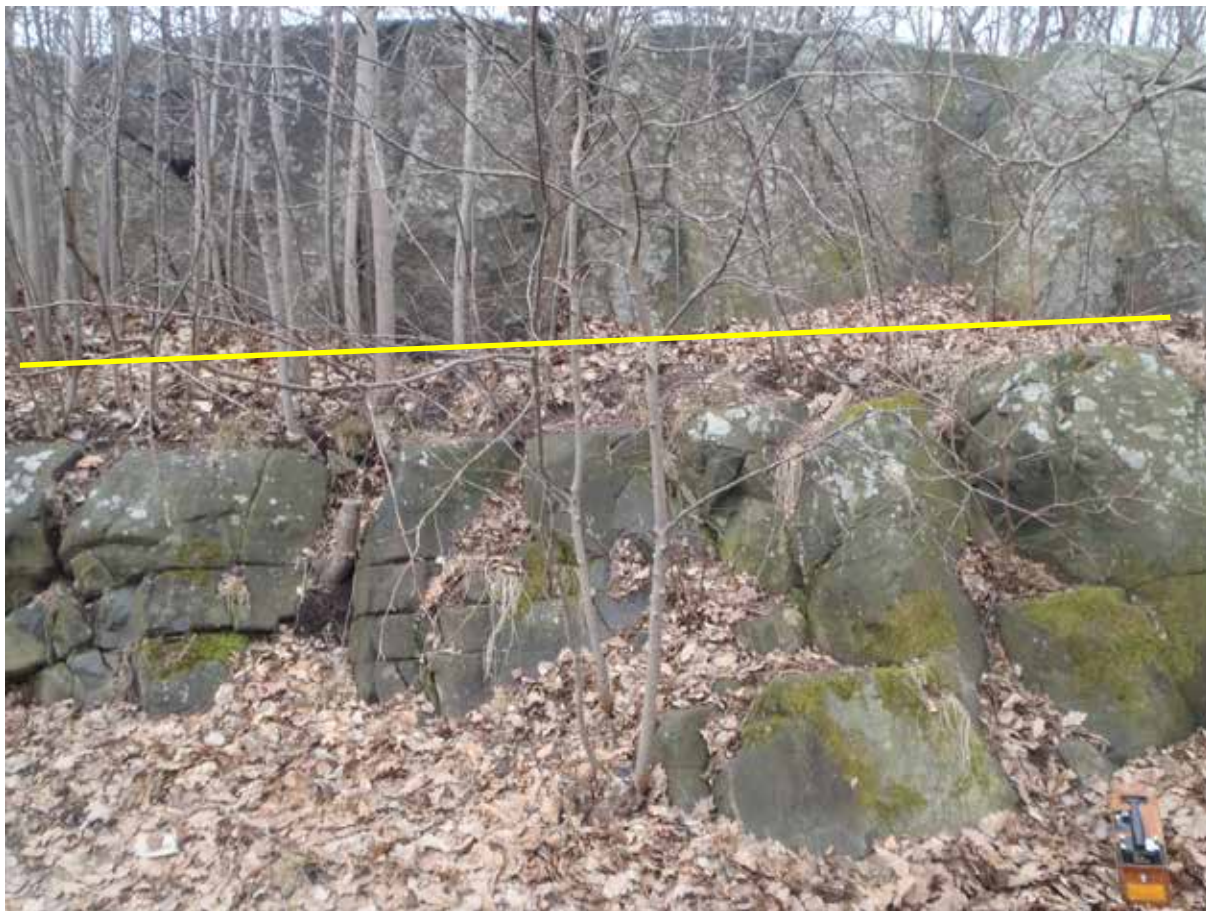
Foto 13. Detalj av foto 12: kontakten (gul) mellan amfibolit i bildens nedre del och gnejs i bildens övre del. Bild tagen mot väst.