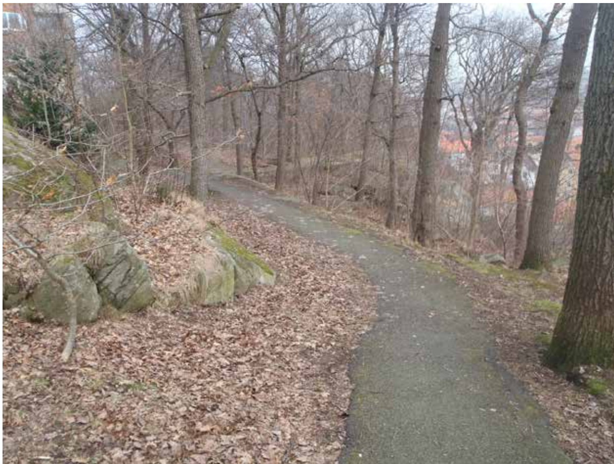
Foto 15. Den norra delen av den östra bergsbranten. Hogenskildsgatan 7-13 i bildens övre vänstra hörn. Bild tagen mot nordöst.