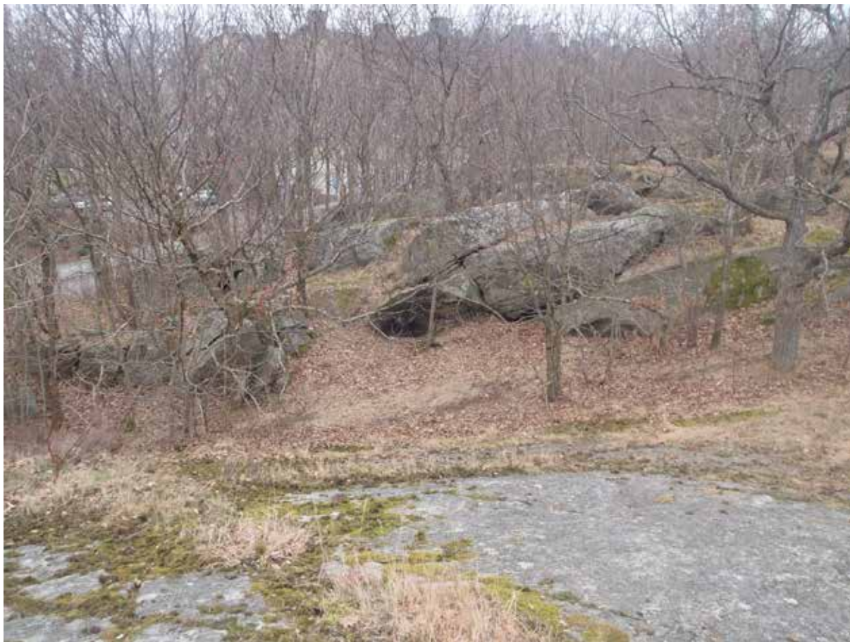
Foto 11. Uppe på höjdryggen är hällarna i allmänhet rundade och platta. Mot väster (vänster i bild) vidtar den "sågtandade" terrängen. Bild tagen mot norr.