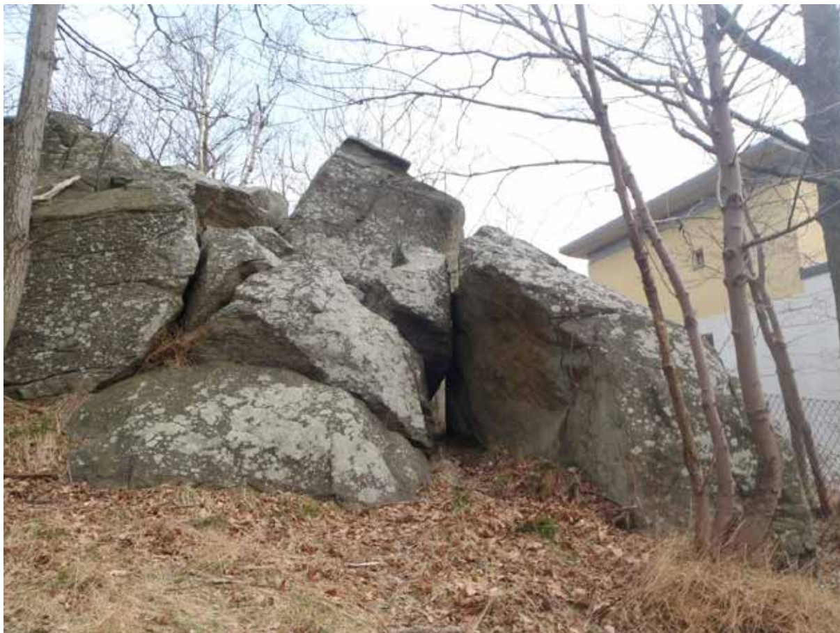
Foto 9. Uppallade lösliggande block ovanför slänkrön mot Kärralundsgatan 8-10 (syns till höger i bild). Blocken bedöms idag vara stabila och inga åtgärder bedöms nödvändiga. Foto taget mot öster.