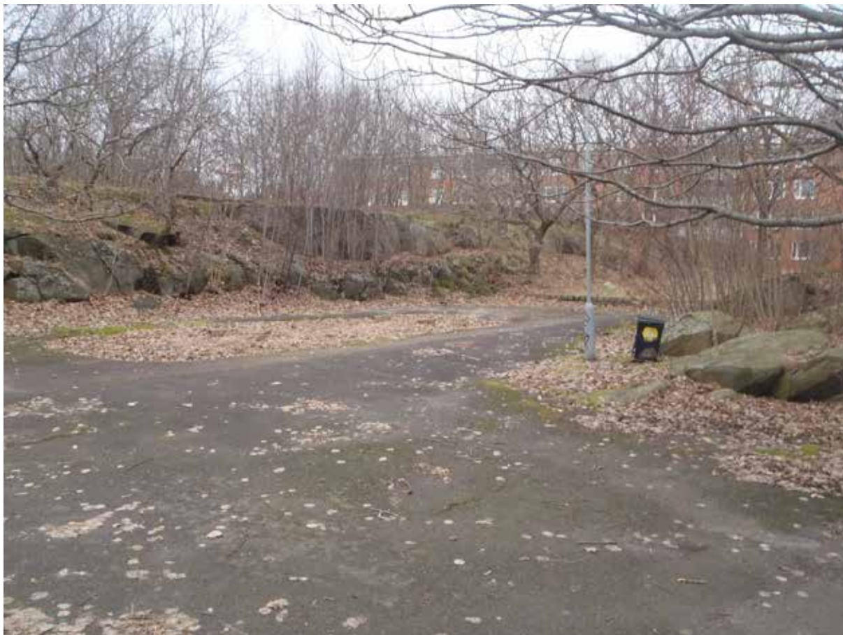
Foto 12. Den stora asfaltytan nära fastigheten Hogenskildsgatan 7-13 (i bakgrunden). Bild tagen mot norr.