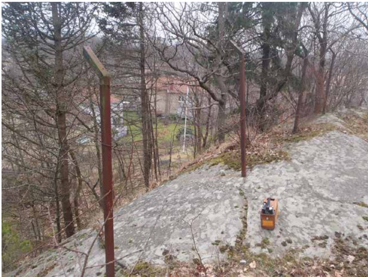
Foto 18. Funktionsodugligt staket ovanför den södra delen av den östra bergsbranten. Branten bedöms vara stabil. Bild tagen mot söder.