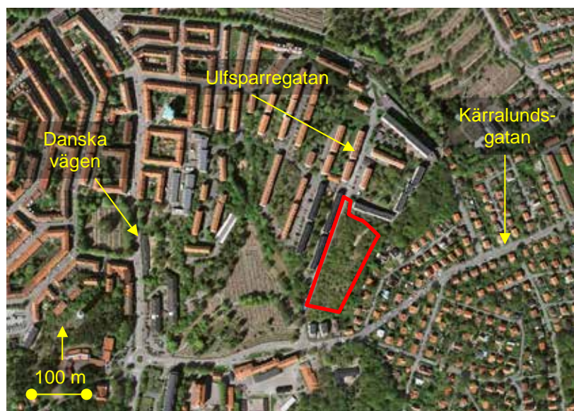
Figur 1. Flygbild över undersökt område (rött).

Det aktuella undersökningsområdet är ca 70x200 m stort och utgörs huvudsakligen av berg i dagen med tunt jordtäckte och vegetation. Se Figur 1 för en orienteringsbild. Den västra sidan av bergspartiet sluttar medelbrant ner mot Ulfsparrégatan medan den östra sidan utgörs av en mer eller mindre vertikal bergsbrant mot Svenslyckegatan. Nya bostäder planeras byggas längs den västra sidan mot Ulfsparrégatan.