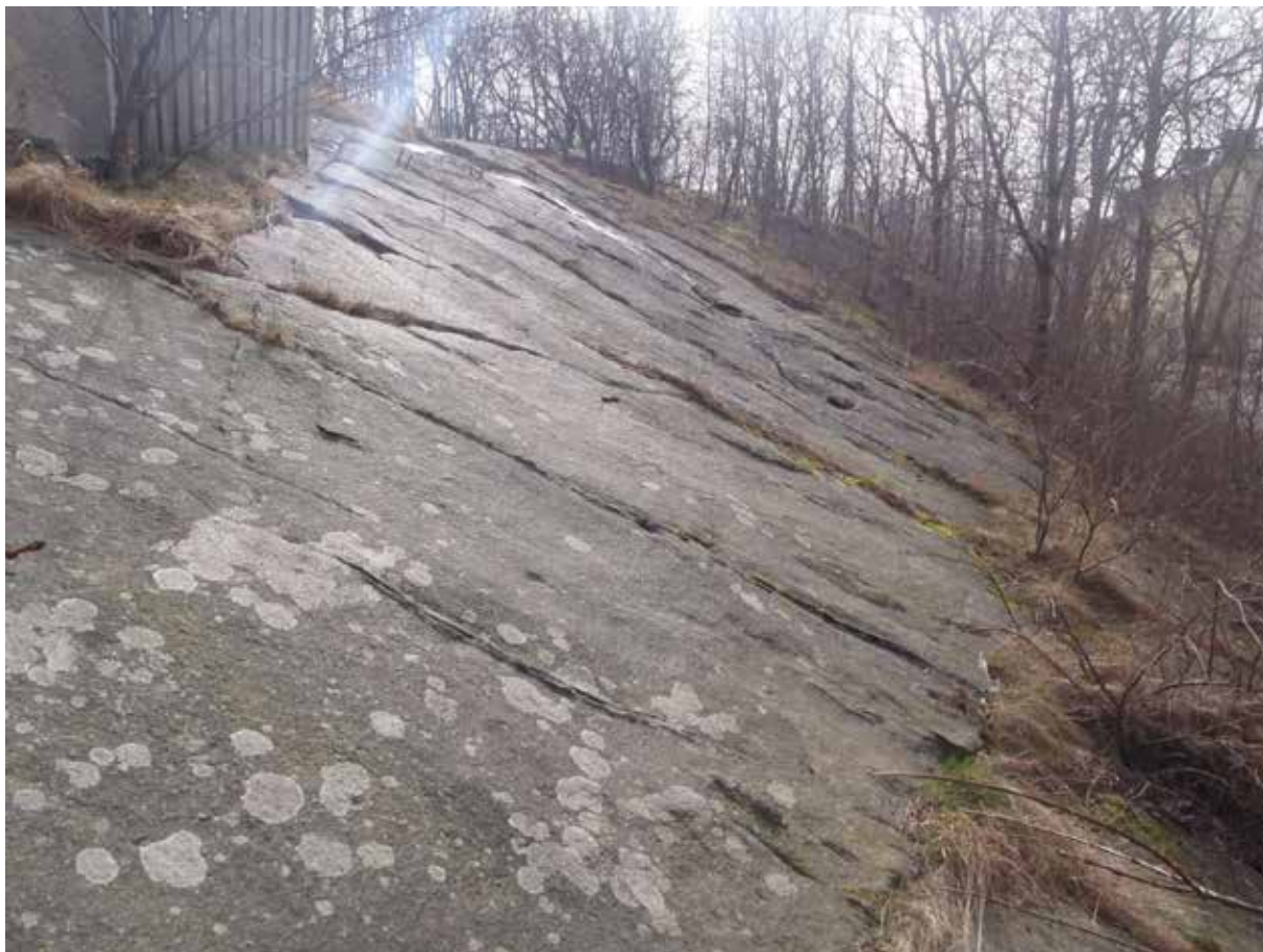
Foto 1. Stabil släntyta vid fastigheten Hogenskildsgatan 7-13. Släntytan bildas av sprickgrupp 1 och lutar medelbrant mot Ulfsparrégatan (till höger i bild). Sprickgrupp 2 löper tvärs slänten och syns som diagonala strimor i bilden. Bild tagen mot söder.