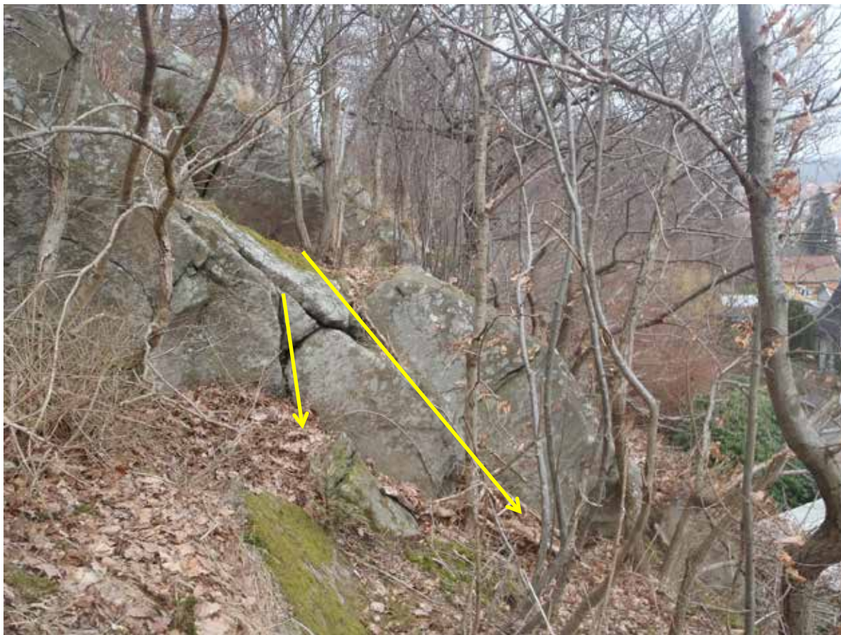
Foto 16. Sprickor som lutar medelbrant-brant mot öster (höger i bild), ovanför Svenslyckegatan 14 (utanför bildens högra sida). Bild tagen mot norr.