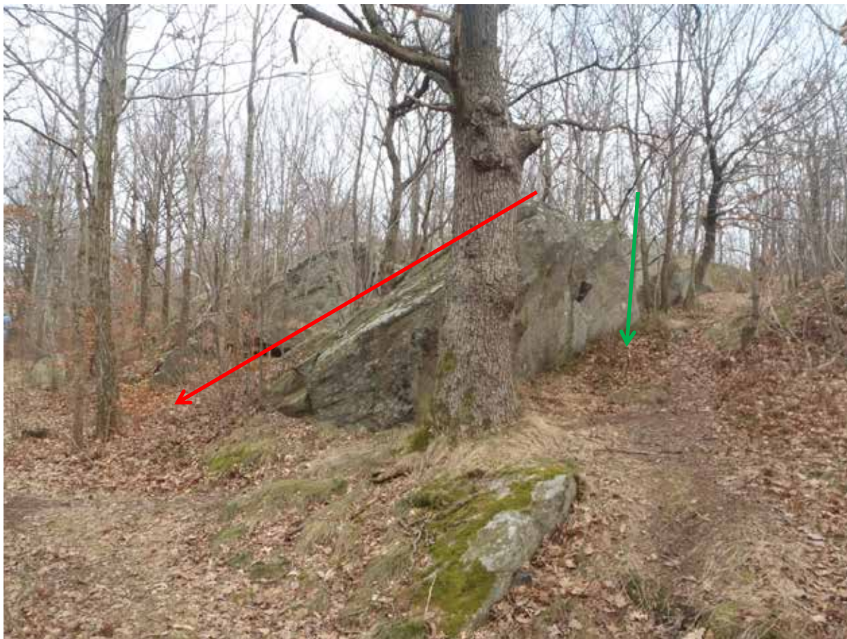
Foto 10. Gnejsens uppsprickningsmönster gör att terrängen får ett "sågtandat" utseende, med sprickgrupp 1:s medelbrant lutande sprickplan (rött) som brant skärs av av sprickgrupp 3 (grönt). Bild tagen mot norr.