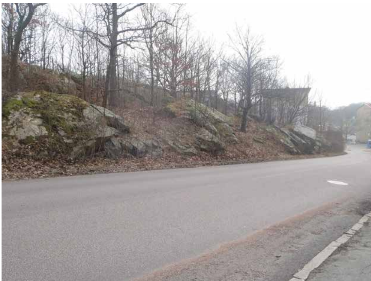
Foto 6. Från parkeringsplatsen vid Ulfspärregatan 11G vidtar bergskärning med sprickgrupp 1-3. Bakom bergskärningen löper en grund "dal" parallellt med gatan och bakom den vidtar ytterligare en bergslänt. Bild tagen mot sydöst.