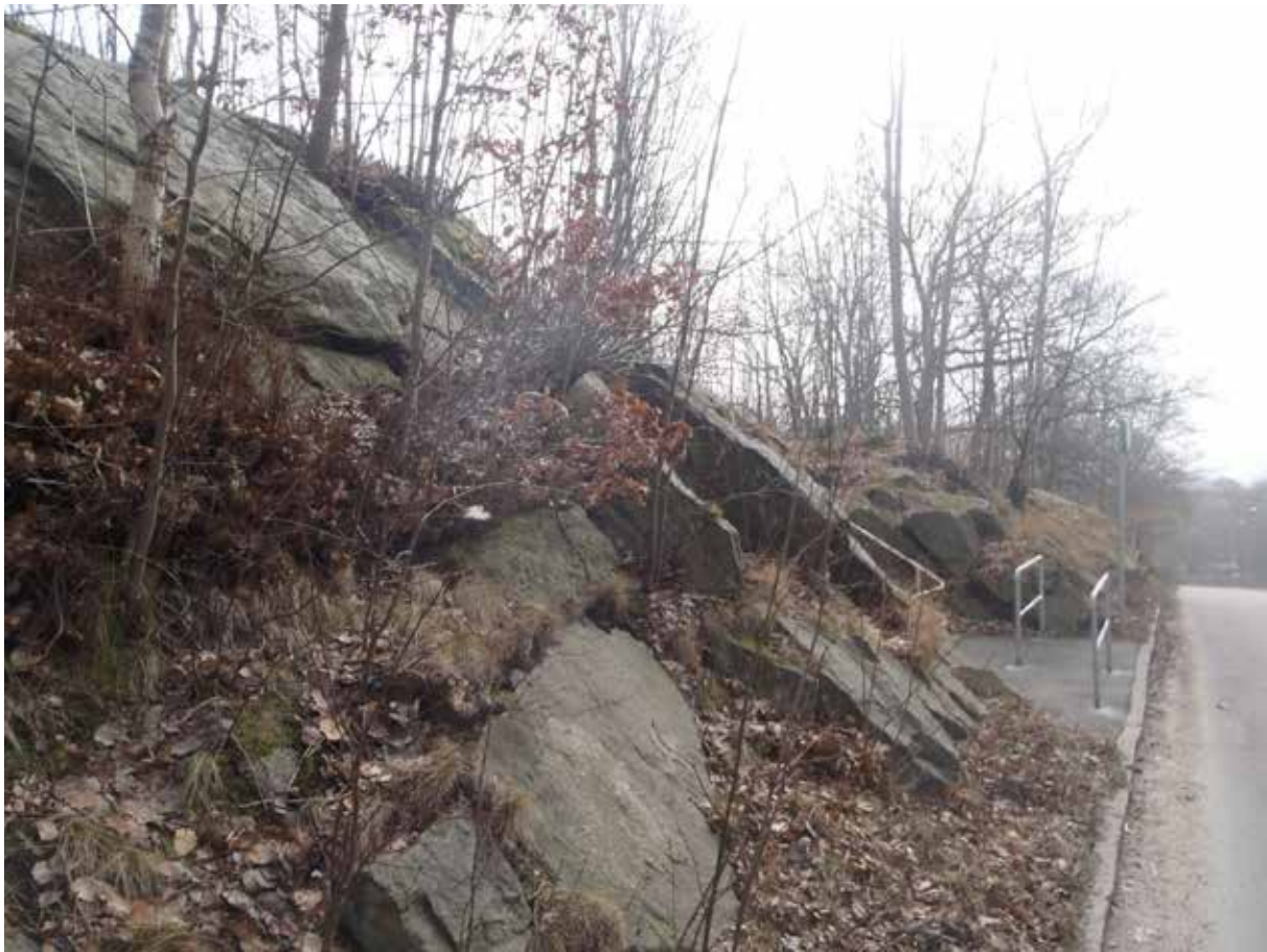
Foto 2. Mer uppsprucket parti mittemot Ulfsparrégatan 9. Foto taget mot söder.