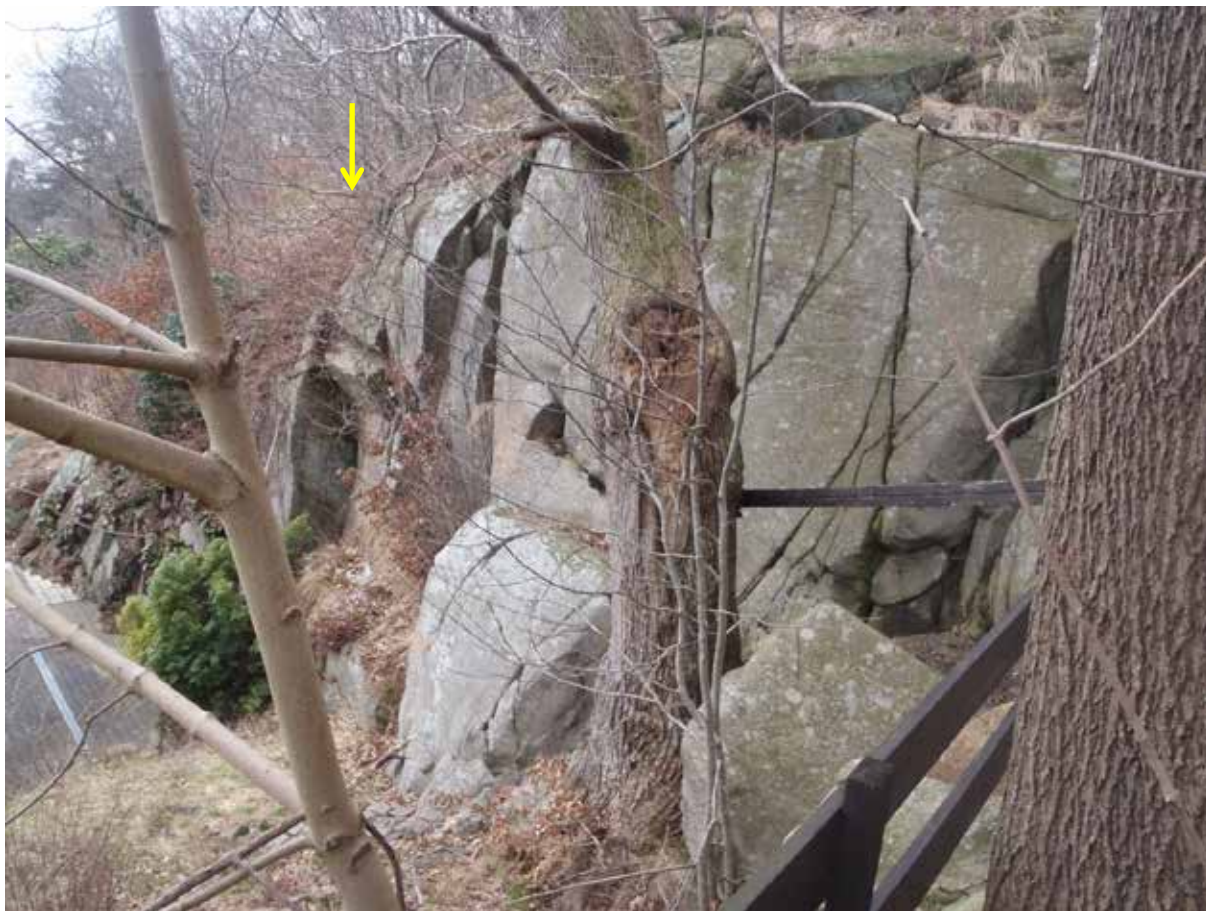
Foto 17. Samma ställe som foto 16, från andra hållet. Pilen pekar på det som visas i foto 16. Bild tagen mot sydväst.