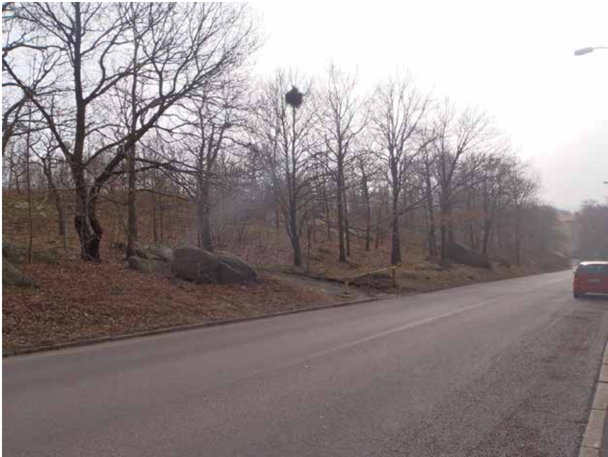
Foto 5. Jord-/blockslänten fortsätter söderut längs fastigheten Ulfsparrégatan 11. Bild tagen mot sydöst.