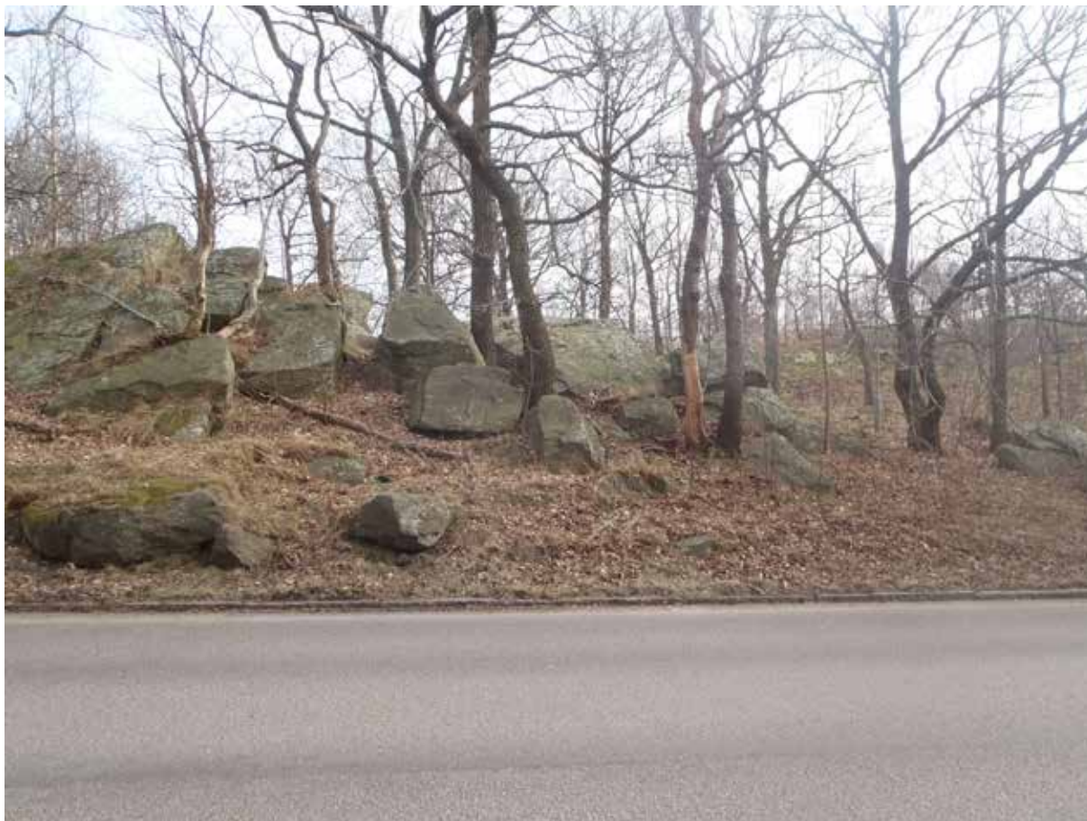
Foto 4. Lösiggande block i jord-/blockslänt längs Ulfsparrégatan. Blocken bedöms idag vara stabila. Foto taget mot öster från Ulfsparrégatan 11C.