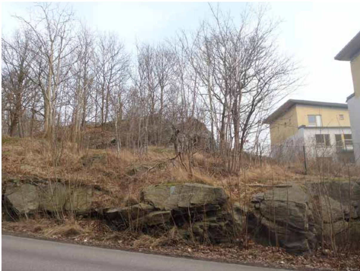
Foto 7. Den sydligaste delen av undersökningsområdet är mer uppsprucken än den norra. Bild tagen mot öster.