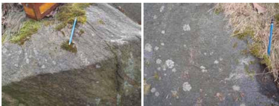
Figur 2. Förekommande bergarter: till vänster ådrad gnejs, till höger amfibolit.

Amfiboliten är finkornig och mörkt grå till svart. Den bildar en skiva eller lins som kan ses högst upp på bergspartiet, vid den stora asfaltytan nära fastigheten Hogenskildsgatan 7-13 (se Foto 13 i Bilaga 1). Den övre kontakten mellan gnejs och amfibolit ser ut att luta medelbrant mot sydöst ( 40^\circ/50^\circ ) medan den undre kontakten tycks luta medelbrant mot nordväst ( 210^\circ/50^\circ ). Amfibolit noterades även i den södra delen av den höga branten på höjdpartiets östra sida, ovanför Svenslyckegatan 2-6. Ingen amfibolit syns i bergskärningen mot Ulfsparrégatan.