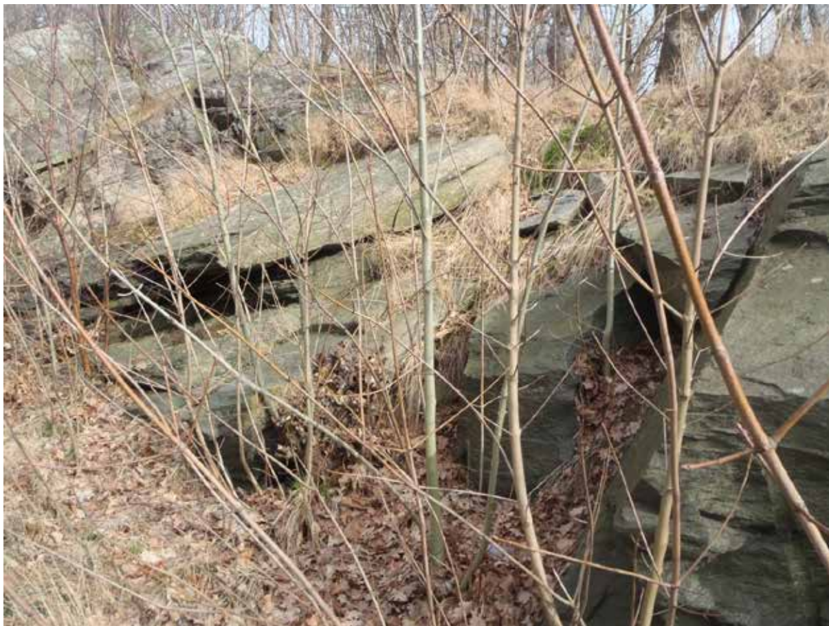
Foto 8. Ökad skivighet och småblockig uppsprickning i den södra delen av bergskärningen längs Ulfsparrégatan. Bild tagen mot nordöst.