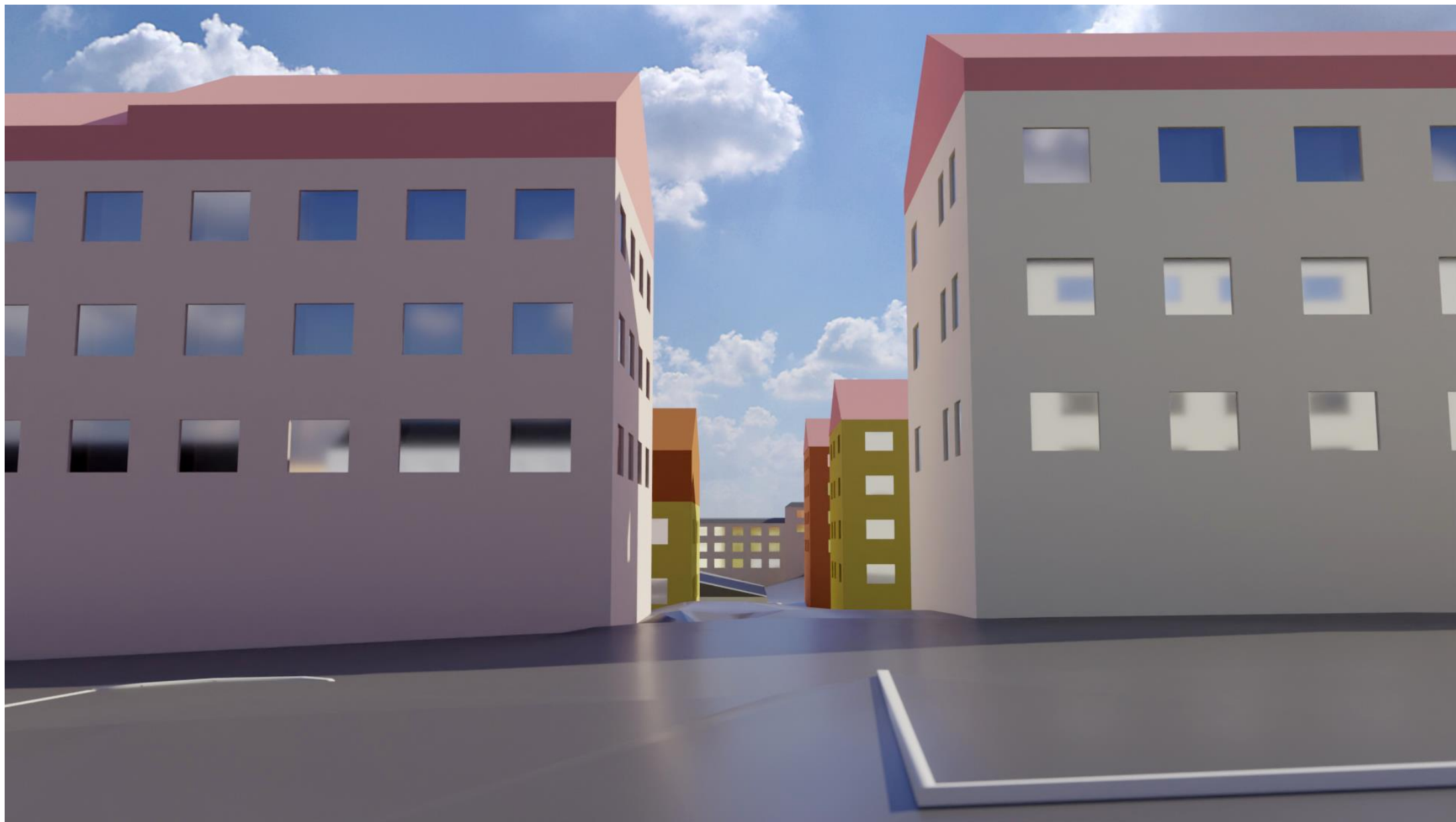
Vy tagen mellan bostadshusen på Snoilskygatan så som platsen ser ut idag. Illustration från Stadsbyggnadsförvaltningen Göteborg.