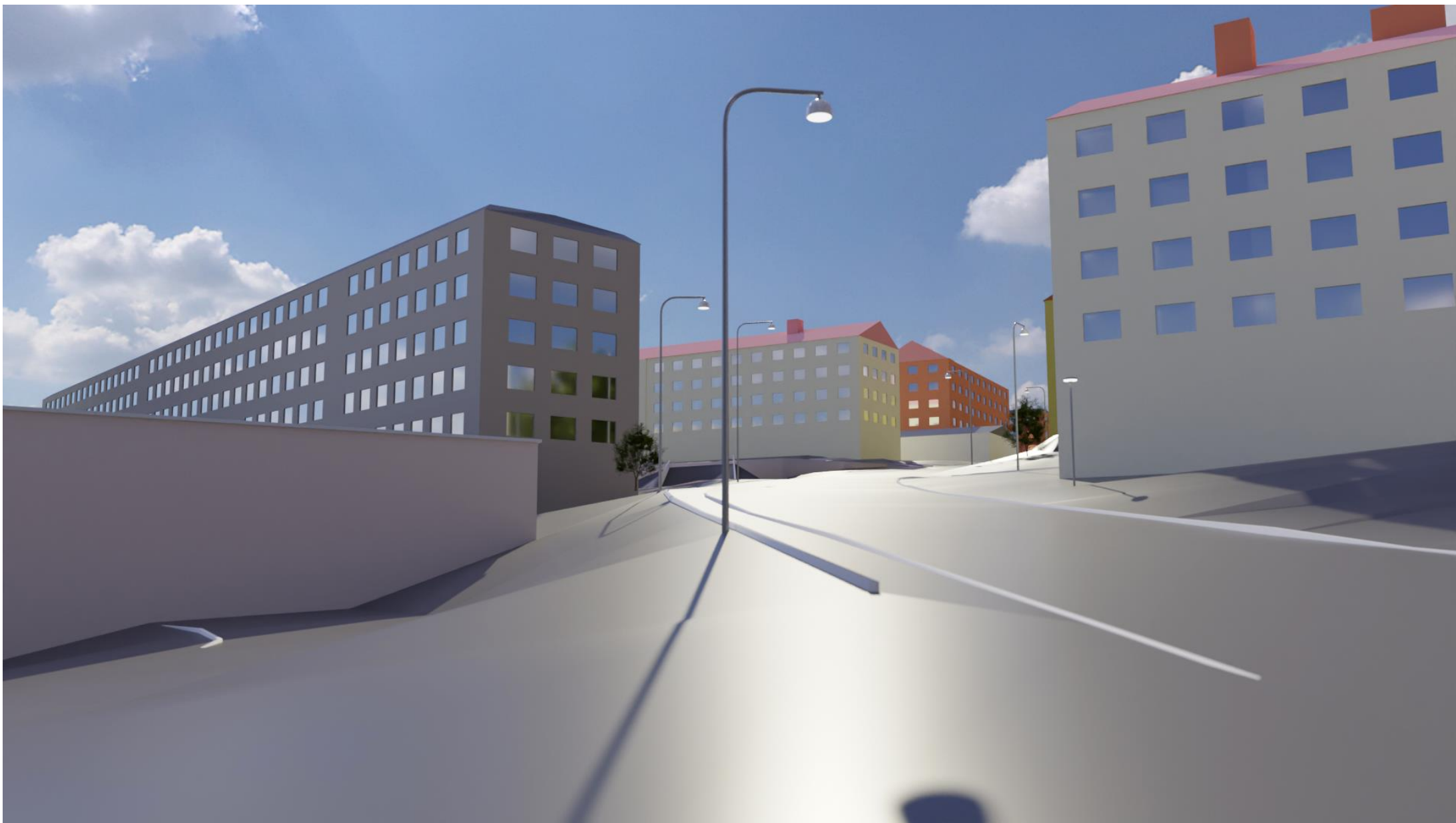
Vy från Ulf Sparregatan från sett från nordväst så som platsen ser ut idag. Illustration från Stadsbyggnadsförvaltningen Göteborg.