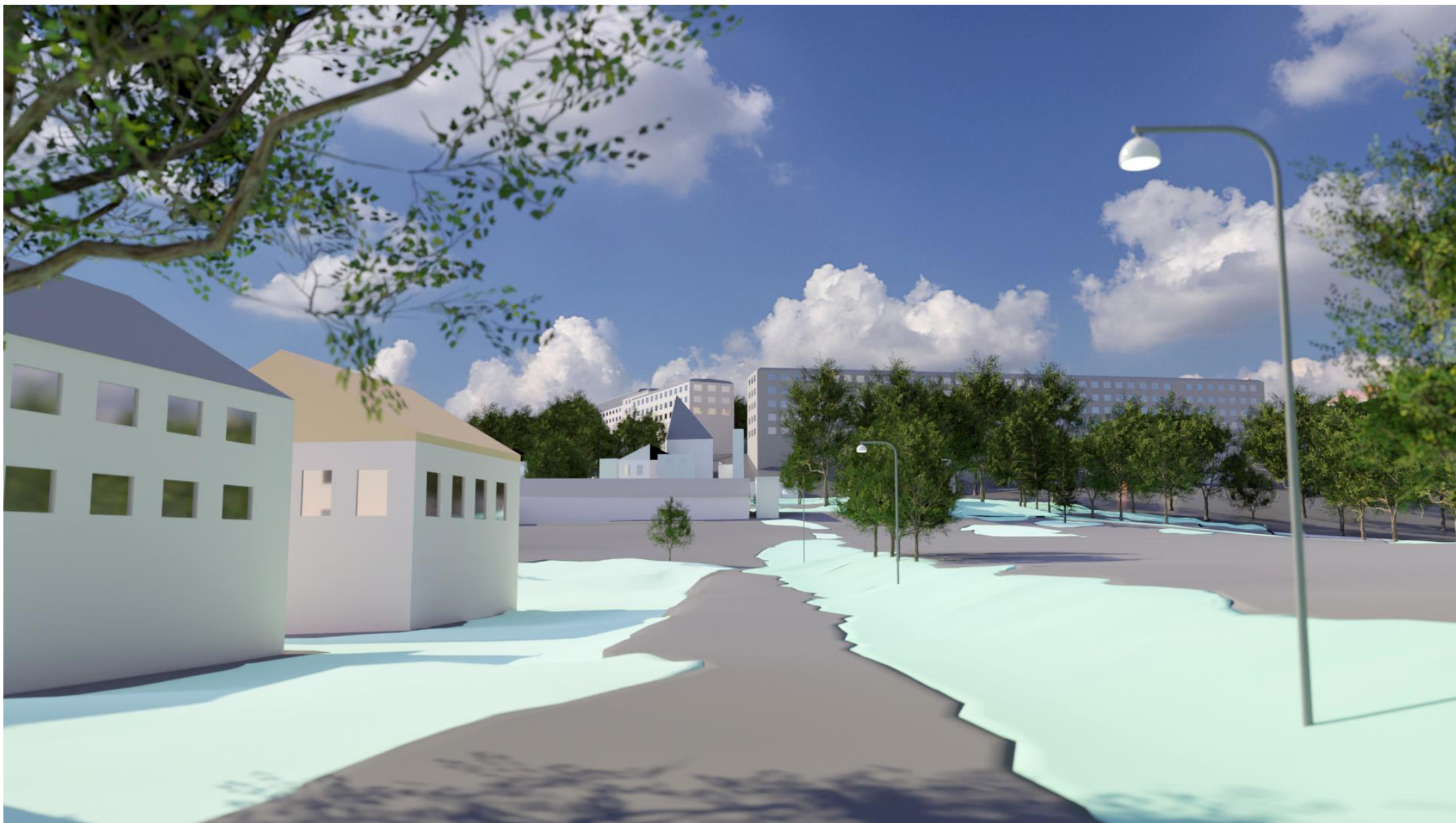
Vy tagen från Kyrkåsplatsen så som platsen ser ut idag. Illustration från Stadsbyggnadsförvaltningen Göteborg.