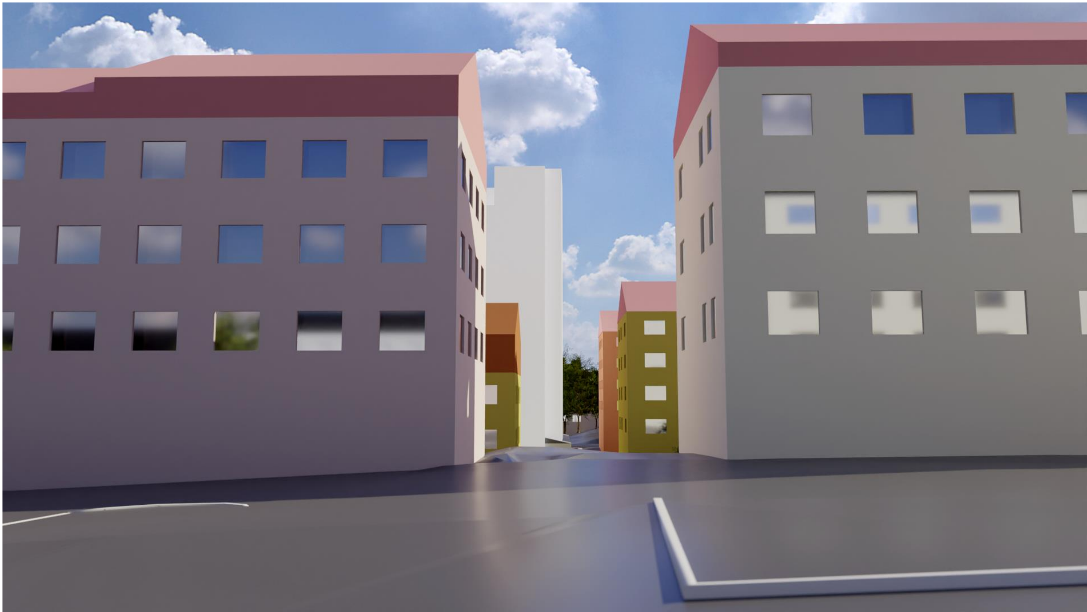
Vy tagen mellan bostadshusen på Snoilskygatan med föreslagen byggnad. Illustration från Stadsbyggnadsförvaltningen Göteborg.