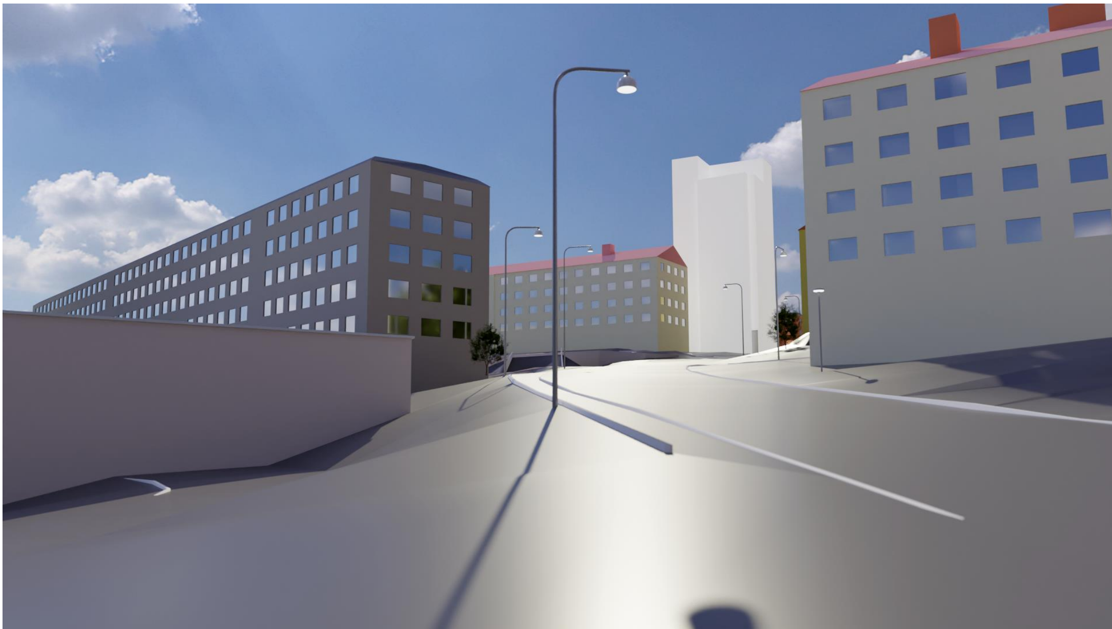
Vy från Ulf Sparregatan från sett från nordväst med föreslagen byggnad. Illustration från Stadsbyggnadsförvaltningen Göteborg.