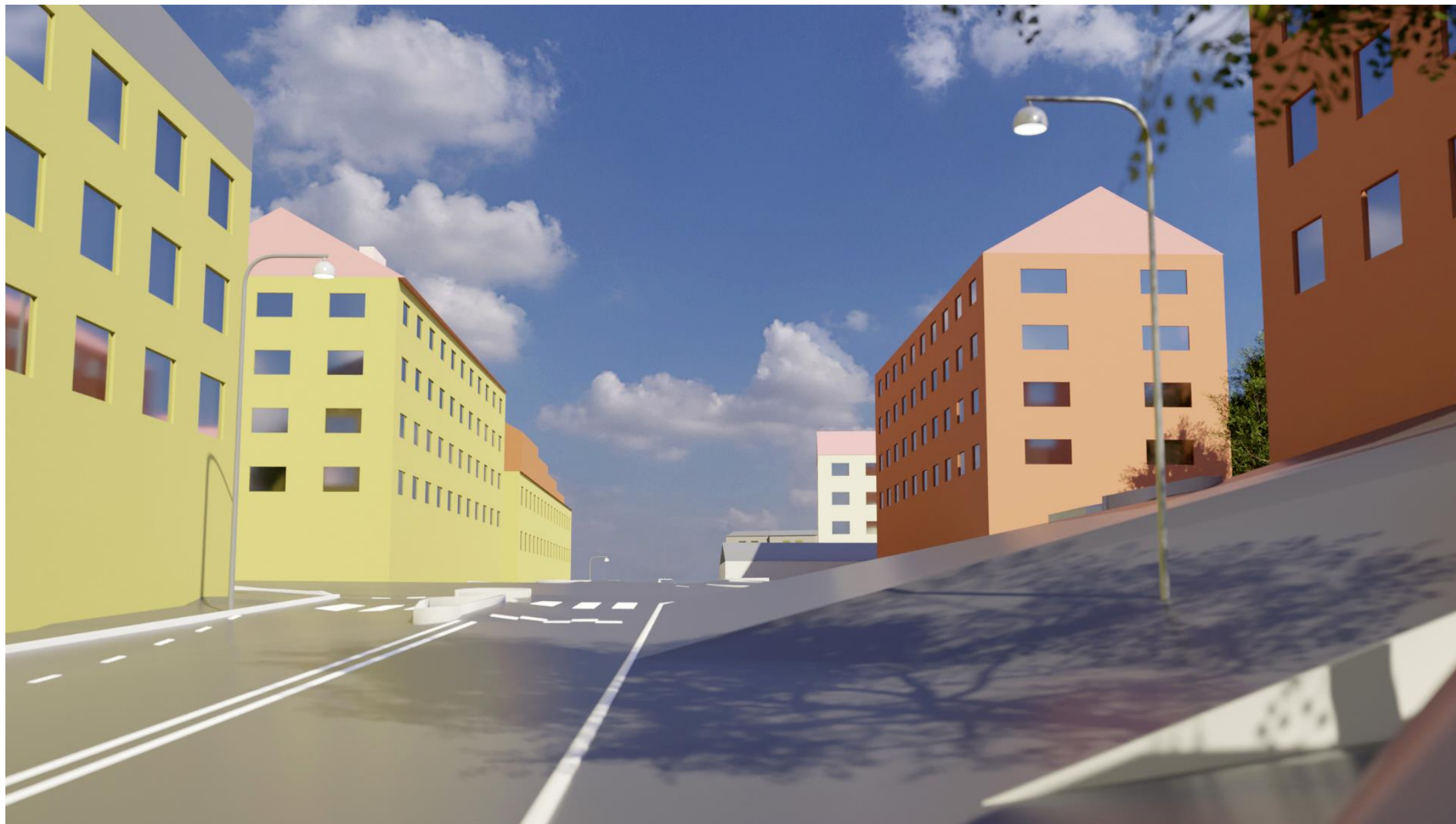
Alla vyerna är tagna på 170 centimeters höjd. Vy från Ulf Sparregatan från sett från sydväst så som platsen ser ut idag. Illustration från Stadsbyggnadsförvaltningen Göteborg.