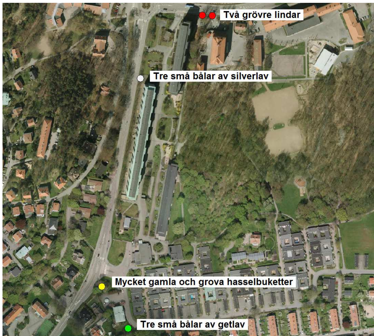
Karta 2. Naturvårdsintressanta arter och element inom området.

Generellt bedöms trädmiljöerna ha en viss positiv betydelse för biologisk mångfald.