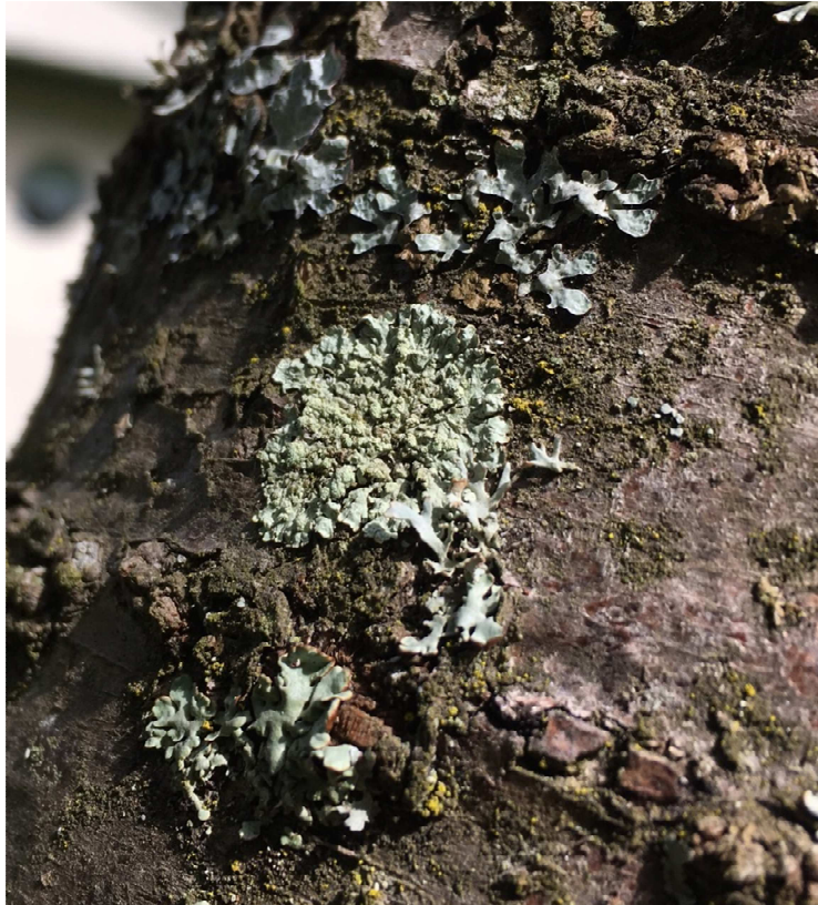
Foto 1. Getlav