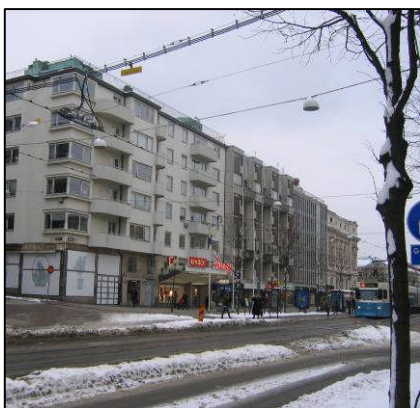
Kv 52 Borgeby

Kvarteret Örbyhus har ett öppet läge vid korsningen Avenyn-Engelbrektsgatan och ligger intill en liten platsbildning. Kvarterets två hörnhus med sina 1800-talsfasader ramar in mellanhusen och utgör viktiga inslag i gatubilden. De har också gårdsutrymmen med ursprunglig karaktär. De enskilda byggnaderna är representanter för tre epoker i Avenyns historia. Hörnhusen tillhör den första, funkishuset Avenyn 29 den andra och byggnadskomplexet Avenyn 31-35 representerar 1960-talets principer för stadsförnyelse. Historien är tydligt avläsbar både vid Avenyn och längs Teatergatan.