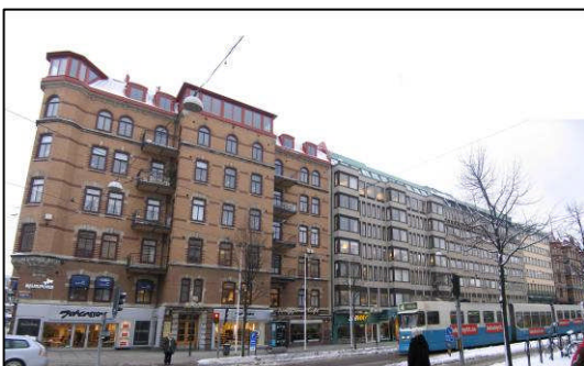
Kv 57 Örbyhus