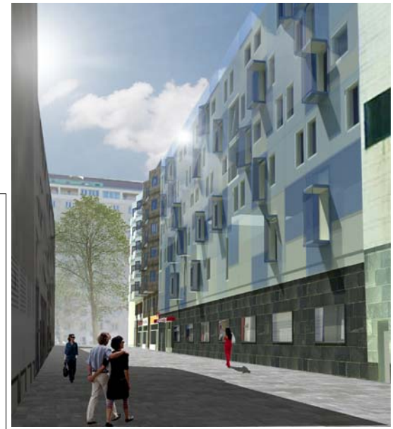
ARKITEKTERNA KROOK & TJÄDER