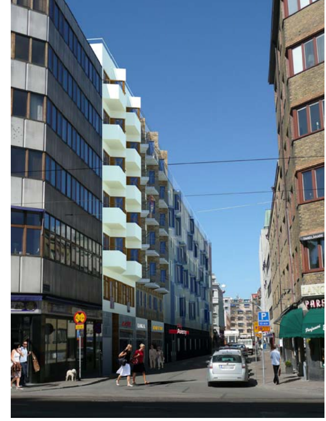
ARKITEKTERNA KROOK & TJÄDER