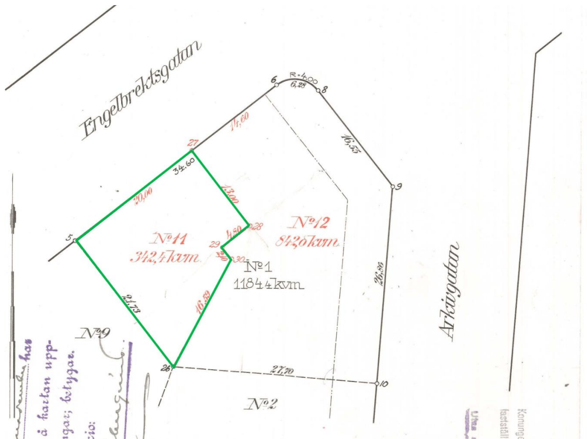
Figur 3: Utsnitt ur gällande tomtindelingskarta. Planområdet markerat med grön linje.

För planområdet gäller fastighetsindelingsbestämmelse, akt III-1218, Ändring i tomtindelningen för del av 5te Kvarteret Axevall i Lorensberg i Göteborg, som vann laga kraft 1928. Planområdet omfattar fastigheten Lorensberg 5:13, tomt nr 11 i tomtindelningen. Fastighetsindelningen är genomförd enligt gällande fastighetsindelingsbestämmelse för fastigheten Lorensberg 5:13.