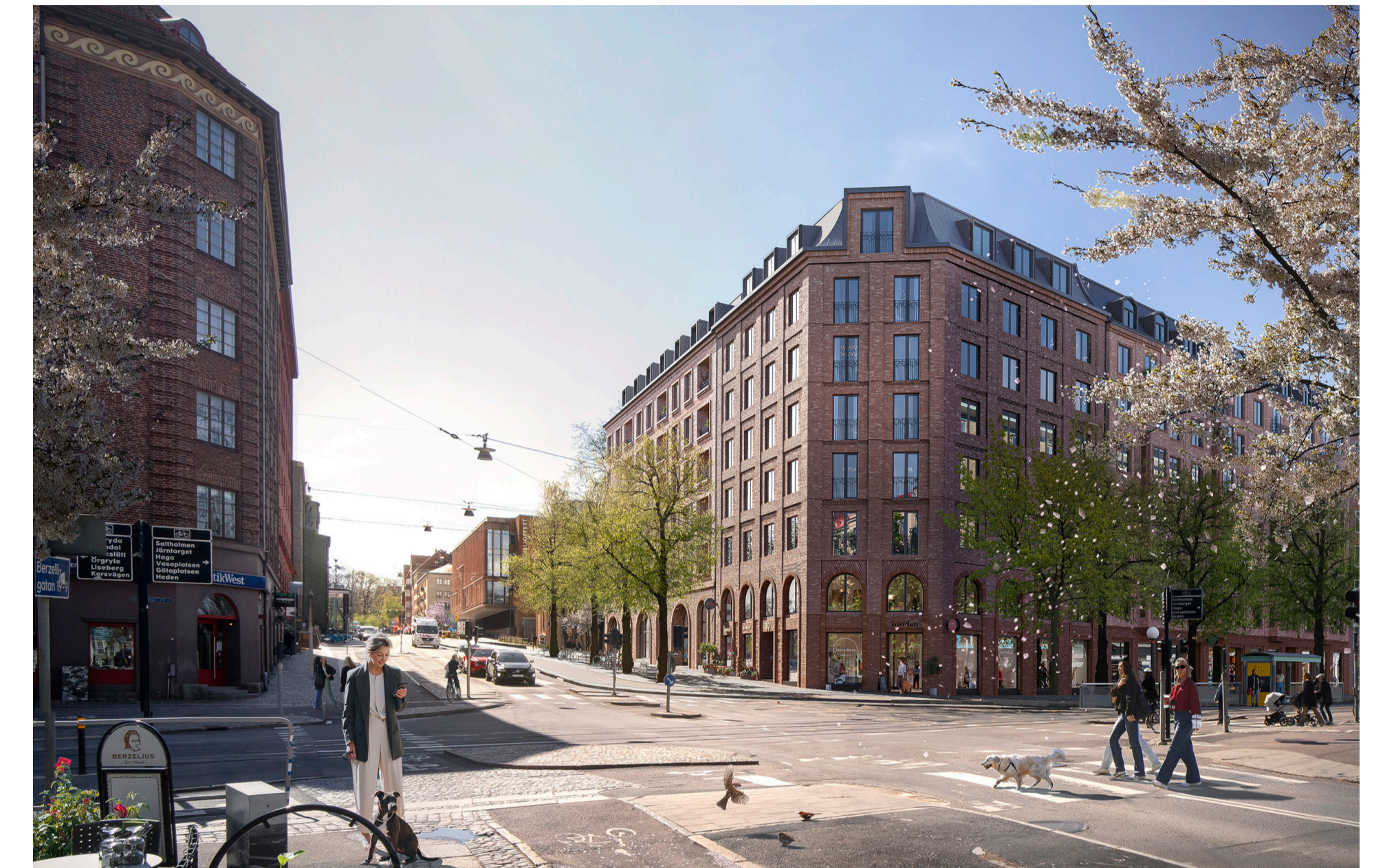
Vy från öster mot det nya kvarteret enligt planförslaget, i korsningen Södra Vägen/Berzeliigatan. Idéskiss, bild: Semrén+Månsson, MARELD, Soul (visualisering).