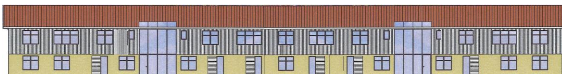
Exempel på förskolebyggnad i två plan.

Detaljplanen innebär att ny byggrätt tillkommer för förskola med åtta avdelningar i två plan. Byggrätten för förskola är belägen i den södra delen av den befintliga fotbollsplanen och omfattar en byggnadsarea (BYA) om 900 m 2 med en högsta byggnadshöjd om 8 meter. Syftet är att förskolan skall uppföras som en långsträckt tvåplansbyggnad som genom sin placering ansluter till det rådande bebyggelsemönstret i området och förtydligar den stora rektangel som utgörs av de öppna ytorna mellan Bjurslättsskolan och Fjärdingsgatan. I större delen av förskolekvarteret har byggrätten begränsats till att enbart tillåta komplementbyggnader. Syftet med denna bestämmelse är att mindre förråd och liknande för förskolegården behov skall kunna uppföras utanför den egentliga byggrätten, dock med en högsta byggnadshöjd på 3 meter. Komplementbyggnader bör utformas på ett sådant sätt att visuellt anpassar sig till omgivningen och uppfattas som ett naturligt inslag i park/gårdsmiljön.