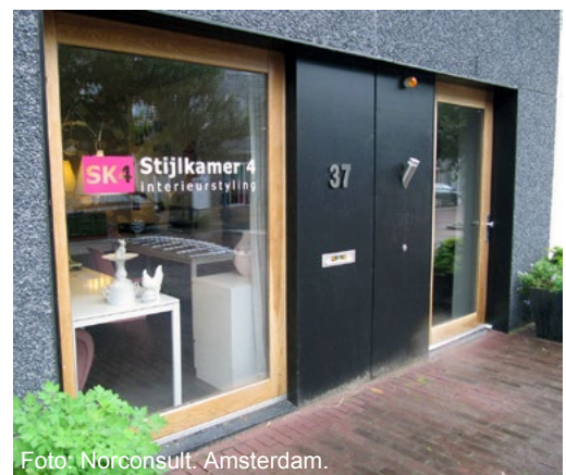
Amsterdam.