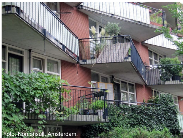
Amsterdam.