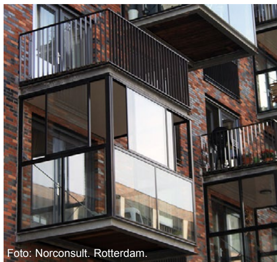
Rotterdam.