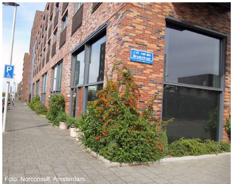
Amsterdam.