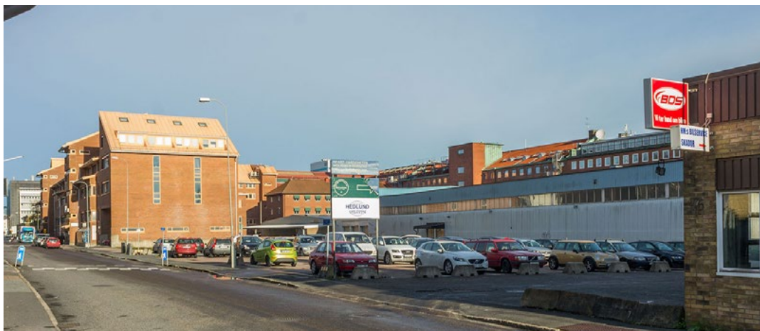
Planområdet från väster