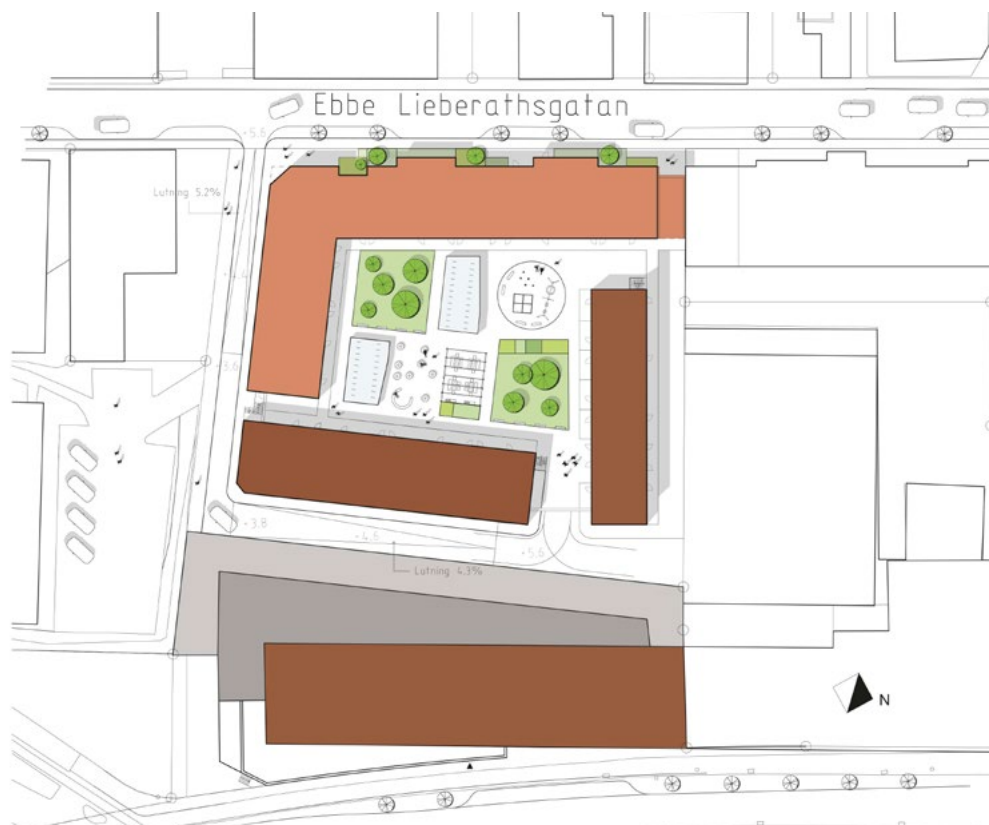
Illustrationsplan för planområdet.

Med tillkommande bostäder ökar behovet av samspelsytor och mötesplatser i närmiljön. En skyddad bostadsgård planeras i mitten av kvarteret vilket möjliggör för lek och vila i anslutning till bostaden. Gården bidrar med ett tryggt halvprivat rum i den annars offentliga miljön. Husens placering och den gemensamma gården skapar goda förutsättningar för kontakter och umgänge mellan boende i kvarteret. Samspelet kan också gynnas av att det planeras lokaler i bottenvåningen för service och verksamheter. När fler personer bor eller driver verksamhet i området stärks sannolikt den lokala gemenskapen.