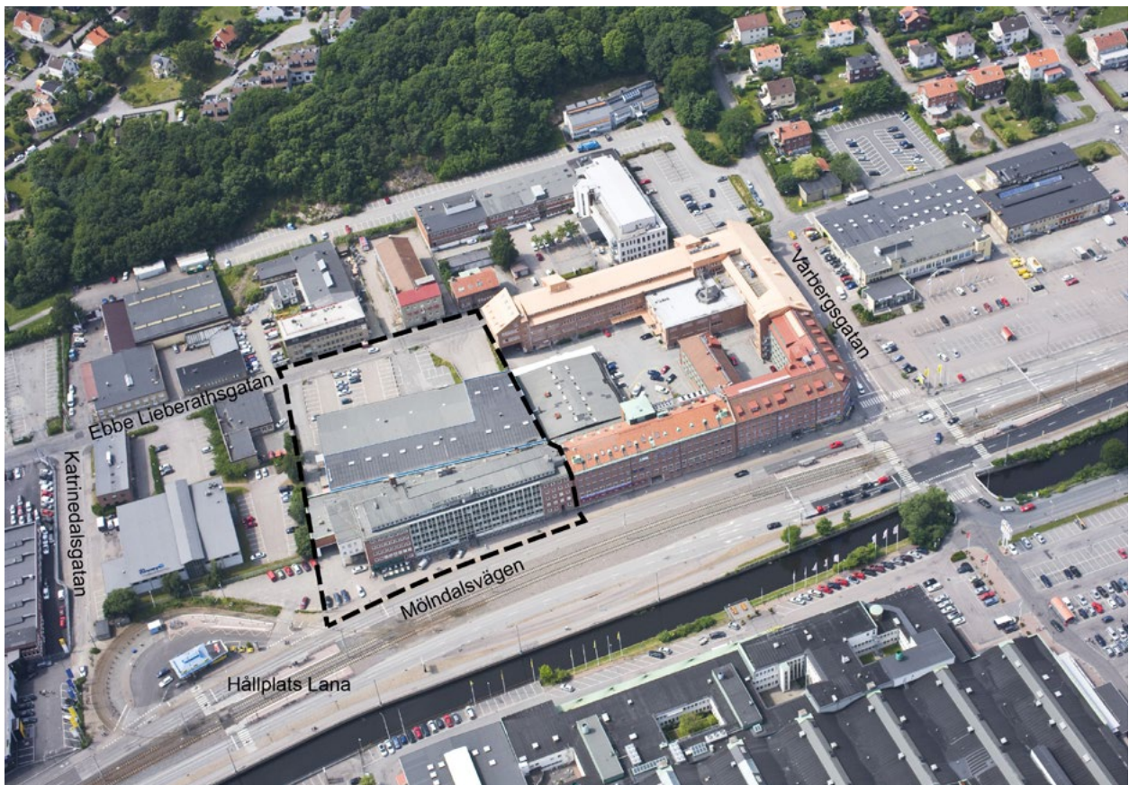
Planområdet sett från öster.

Syftet med den sociala konsekvensanalysen och barnkonsekvensanalysen är att beskriva konsekvenserna av planen och rekommendera åtgärder utifrån ett socialt perspektiv. Målet är att analysen ska bidra till att utvecklingen sker med stor hänsyn till sociala värden och barnperspektivet.