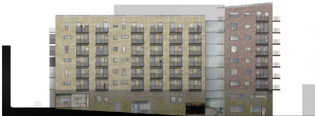
Bostadshuset med fasad mot syd. Kjellgren Kaminsky Architecture/ Hedlund Gruppen.

Den nya bostadsbebyggelsen bidrar till omvandlingen av Mölndalsåns dalgång från industrimiljö till blandstad. Därmed skapas en bättre kontinuitet i stadsstrukturen och en mer sammanhållen stadsdel, utan områden med allt för ensidig karaktär.