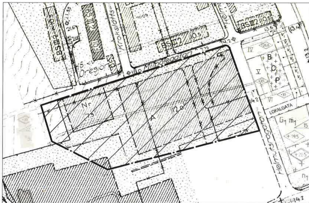
GÄLLANDE DETALJPLANER II-2542 OCH II-2583 SOM UPPHÄVS INOM PLANOMRÅDET

Antagen av KF / BN den 21/6 2022 § 327 / Laga kraft den 19/9 2022 / Edö