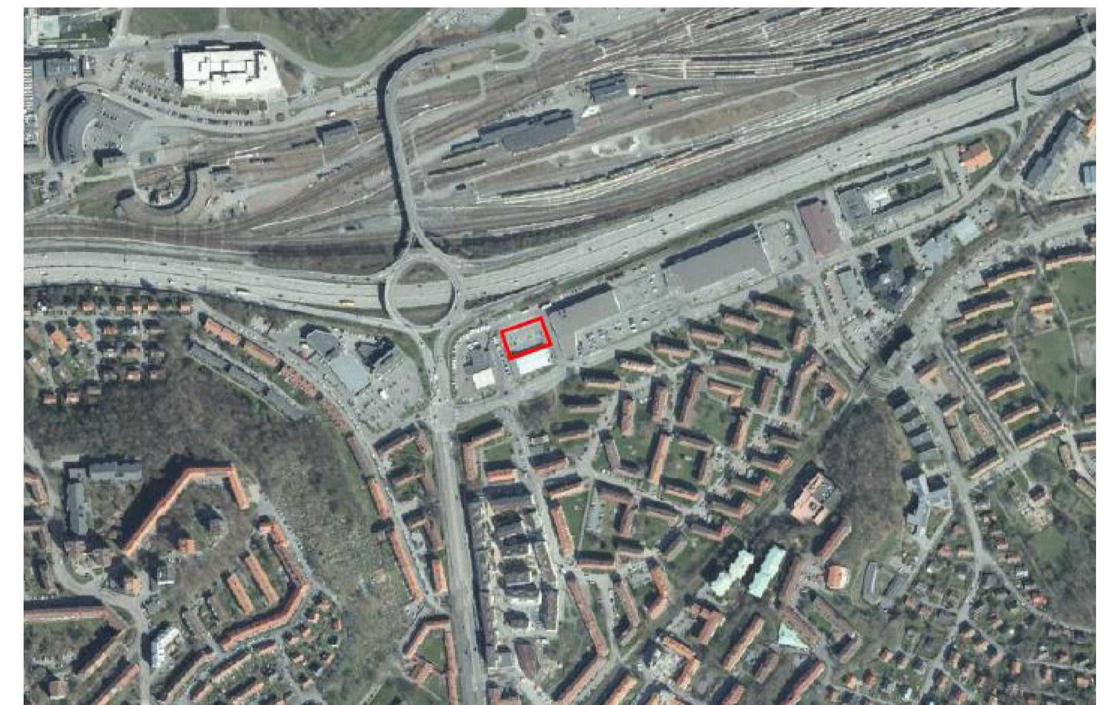
Planområdets läge vid Munkebacksmotet (Göteborgs stad)