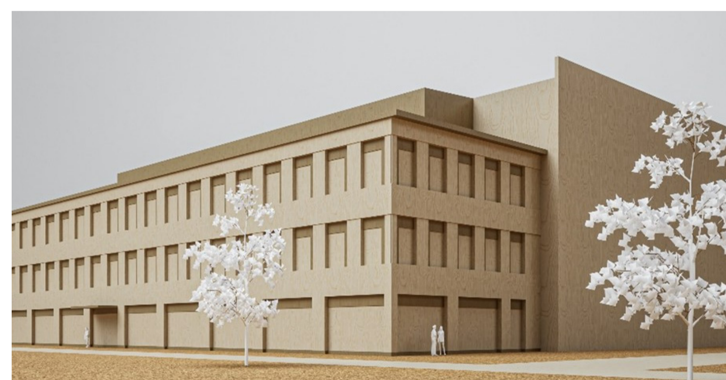
Volymstudie som visar ett möjligt sätt att bygga ut kontoret/arkivet i den södra planområdesdelen. Vy från Amatörradiogatan i söder. (Fredblad arkitekter)