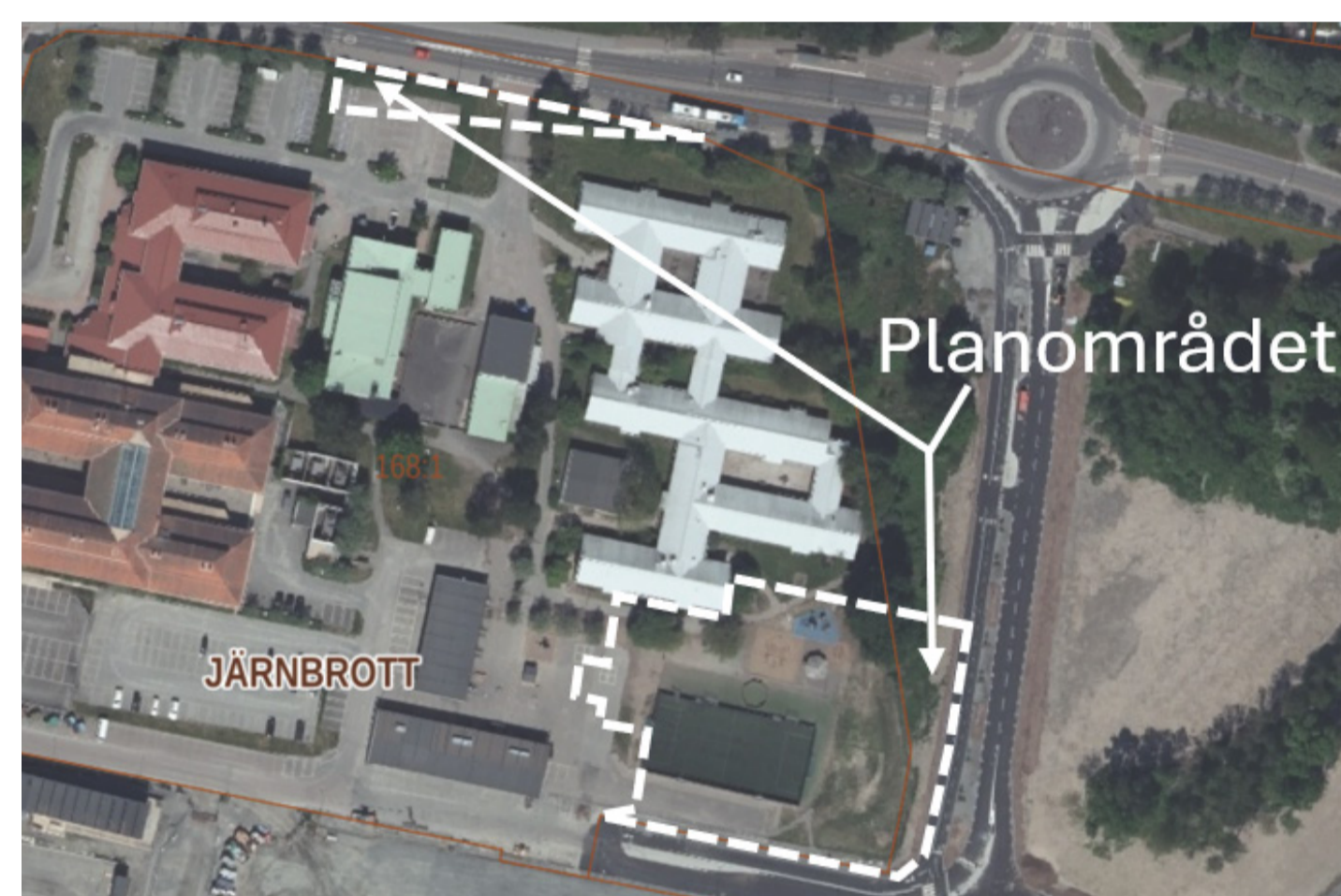
Planområdets två delområden. Kontor och transformatorstation möjliggörs i den södra planområdesdelen (Stadsbyggnadsförvaltningen, 2026)

» Detaljplanen har tidigare varit på granskning under perioden 2 november–2 december 2022 och under perioden 19 december 2022–16 januari 2023 samt 4 juni –1 juli 2025. Större omtag har gjorts i planen efter granskning 3, år 2025, och en ny granskning är därför nödvändig.