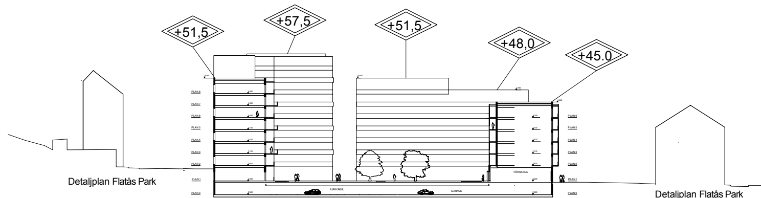
Principsektion Hus 4, Skala 1:500 (A1) Skala 1:1000 (A3) Principsektion Hus 5, Skala 1:500 (A1) Skala 1:1000 (A3)