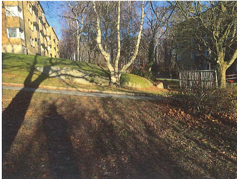
Figur 2. Bilden visar område klassat som Stabilitetszon 1.

Slutsatsen efter utförd okulärbesiktning av stabilitetsförhållandena inom området är att inga hinder med hänsyn till stabilitet finns avseende planerad påbyggnad av befintliga bostadshus i Kaverös.