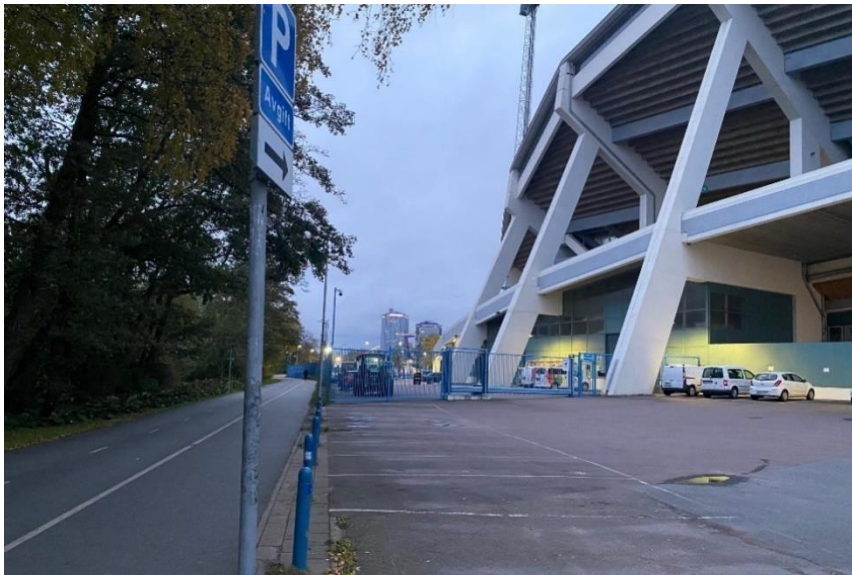
Figur 5 Bild som illustrerar vikten av att arbeta aktivt med utformning och placering av funktioner i mötet mellan arena och åstråk (Åstråkets möte med Ullevi).

Åstråkets yta disponeras om men varken dess totala grönyta eller stråkets bredd ökar. Således är utvecklingen av Åstråket inte tillräcklig för att uppnå kriterierna för en bostadsnära park och möter således inte Gårdas behov av park. Gårda får däremot genom den nya Blekebron en närmare koppling till Burgårdsparken. Närheten till Burgårdsparken för boende i Gårda överstiger dock fortsatt 300 meter vilket innebär att parken inte tillräckligt nära för att uppnå kriterierna för bostadsnära park.