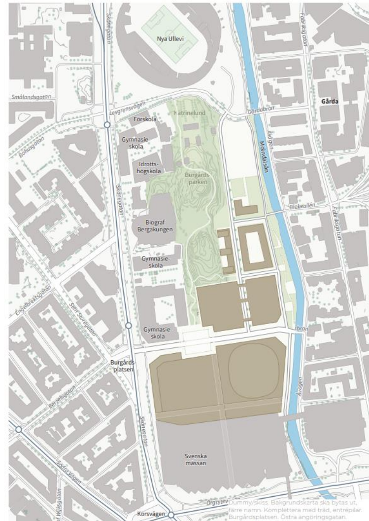
Figur 3. Illustration av planförslaget