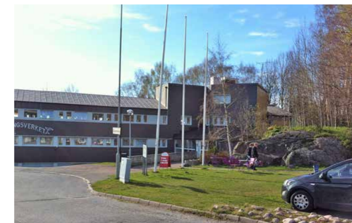
Bebyggelse vid Gruvgatans högplatå invid Änggårdsbergen