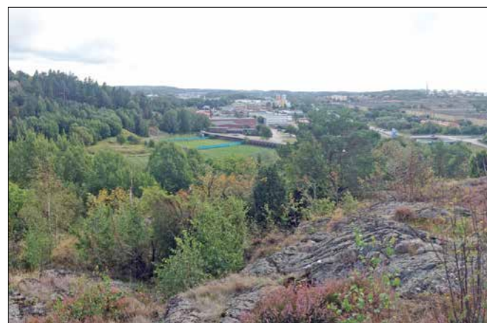
Utsikt över programområdet från norr

Grundprincipen vid utbyggnader och förändringar i programområdet är att ägarna till de fastigheter som får ny eller förändrad markanvändning ska vara med och finansiera den upprustning som krävs av gator och allmän plats för att området ska utgöra en god bostadsmiljö.