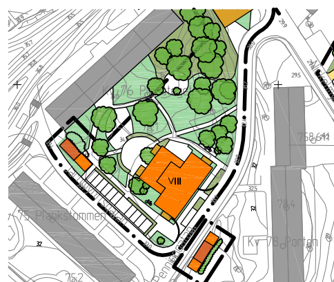
Alternativ med punkthus på Familjebostädernas gård.