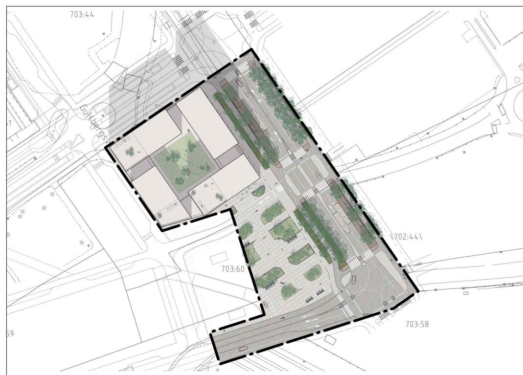
Huvudalternativ med bangårdsförbindelse