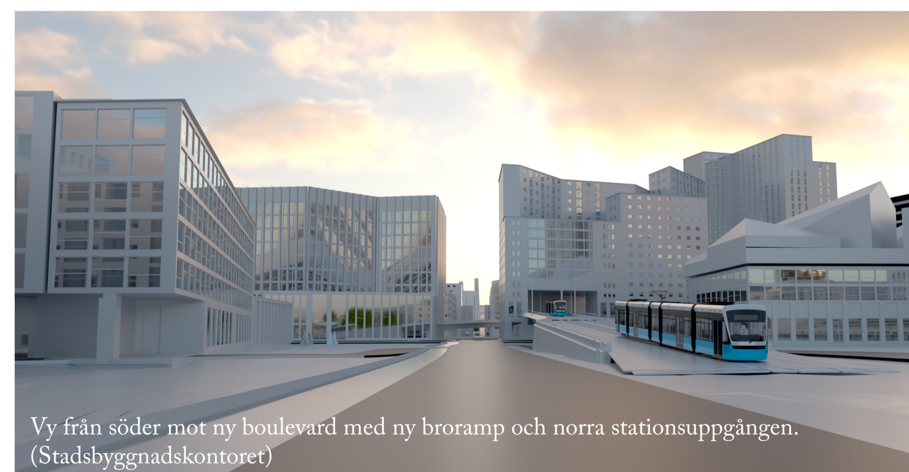
Vy från söder mot ny boulevard med ny broramp och norra stationsuppgången.

Ange diarienummer 1345/15 Senast 9 mars 2022