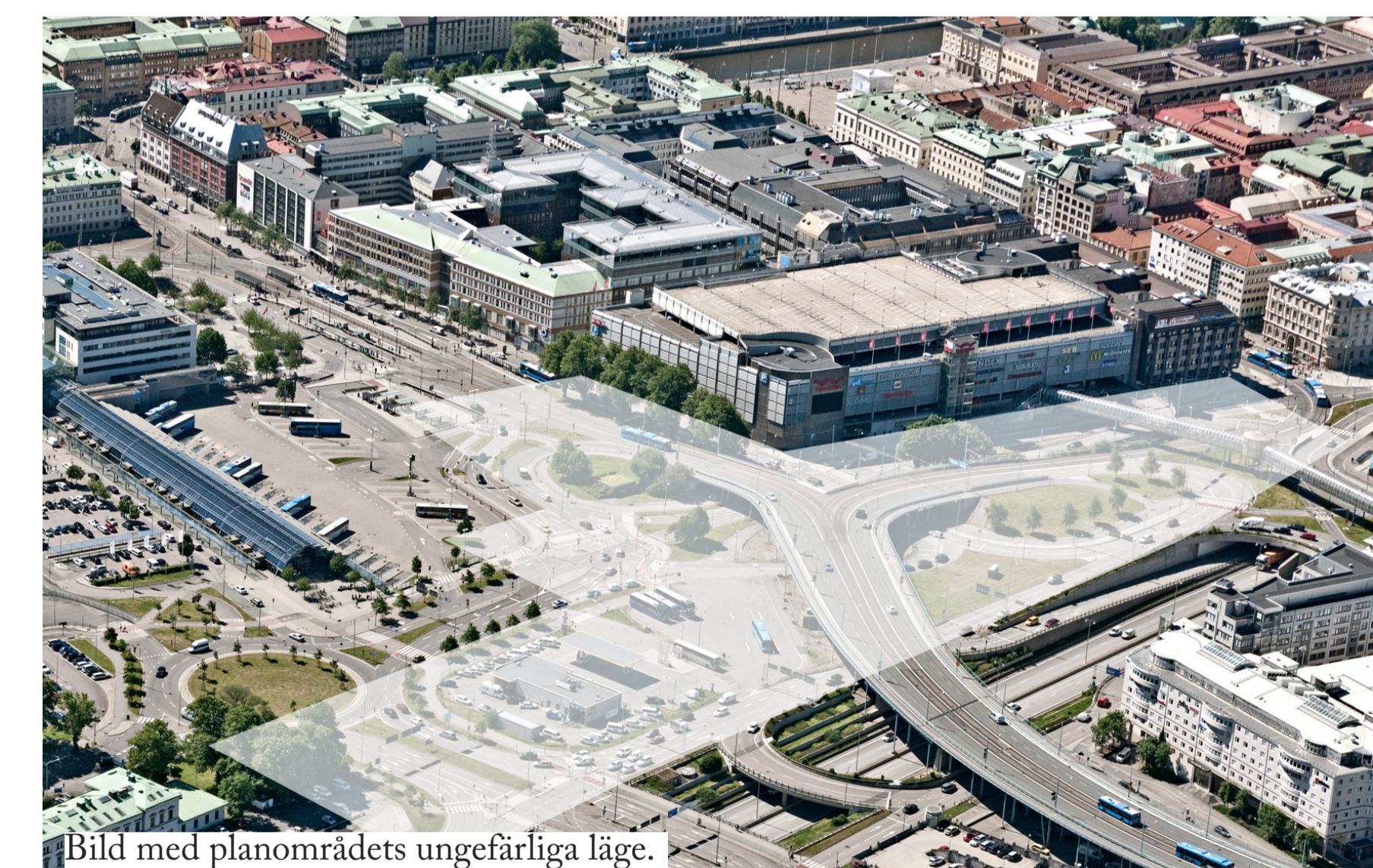
Bild med planområdets ungefärliga läge.