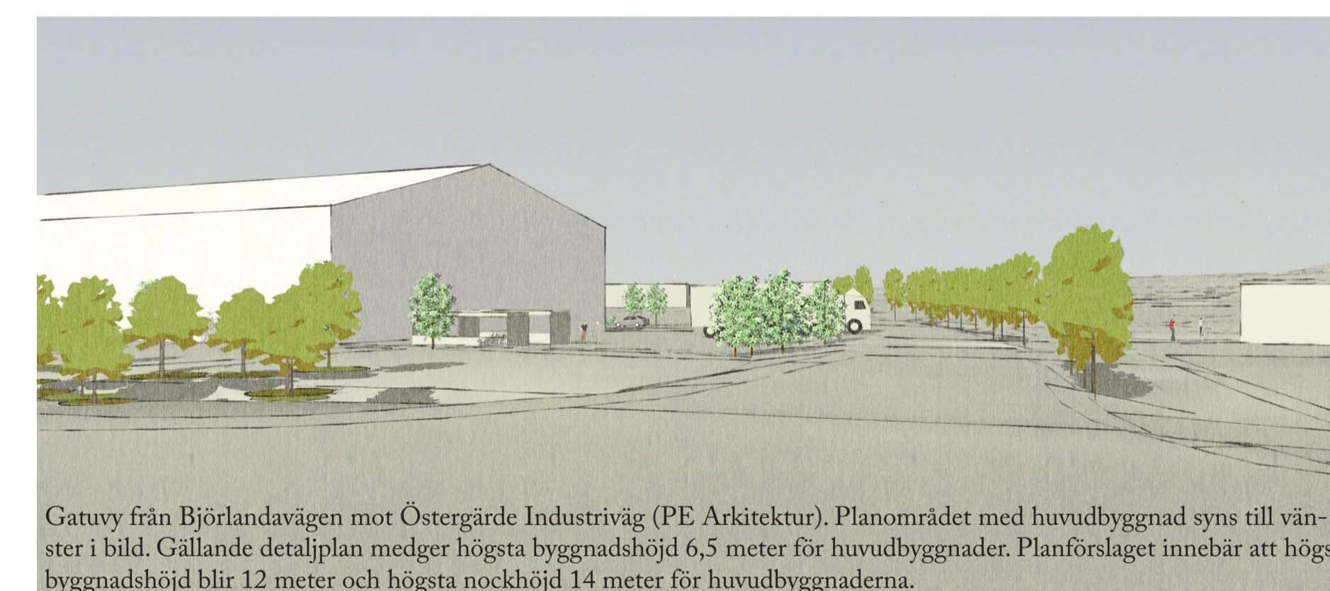
Gatuvy från Björlandavägen mot Östergärde Industriväg (PE Arkitektur). Planområdet med huvudbyggnad syns till vänster i bild. Gällande detaljplan medger högsta byggnadshöjd 6,5 meter för huvudbyggnader. Planförslaget innebär att högsta byggnadshöjd blir 12 meter och högsta nockhöjd 14 meter för huvudbyggnaderna.