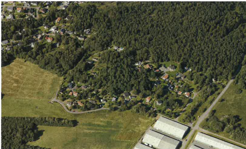
Flygfoto från 2016, i det övre vänstra hörnet ser vi område där bestämmelserna upphävdes 2004.

Syftet med upphävandet är att bygglovsansökningar inte ska begränsas av de bestämmelser som ges av områdesbestämmelserna.