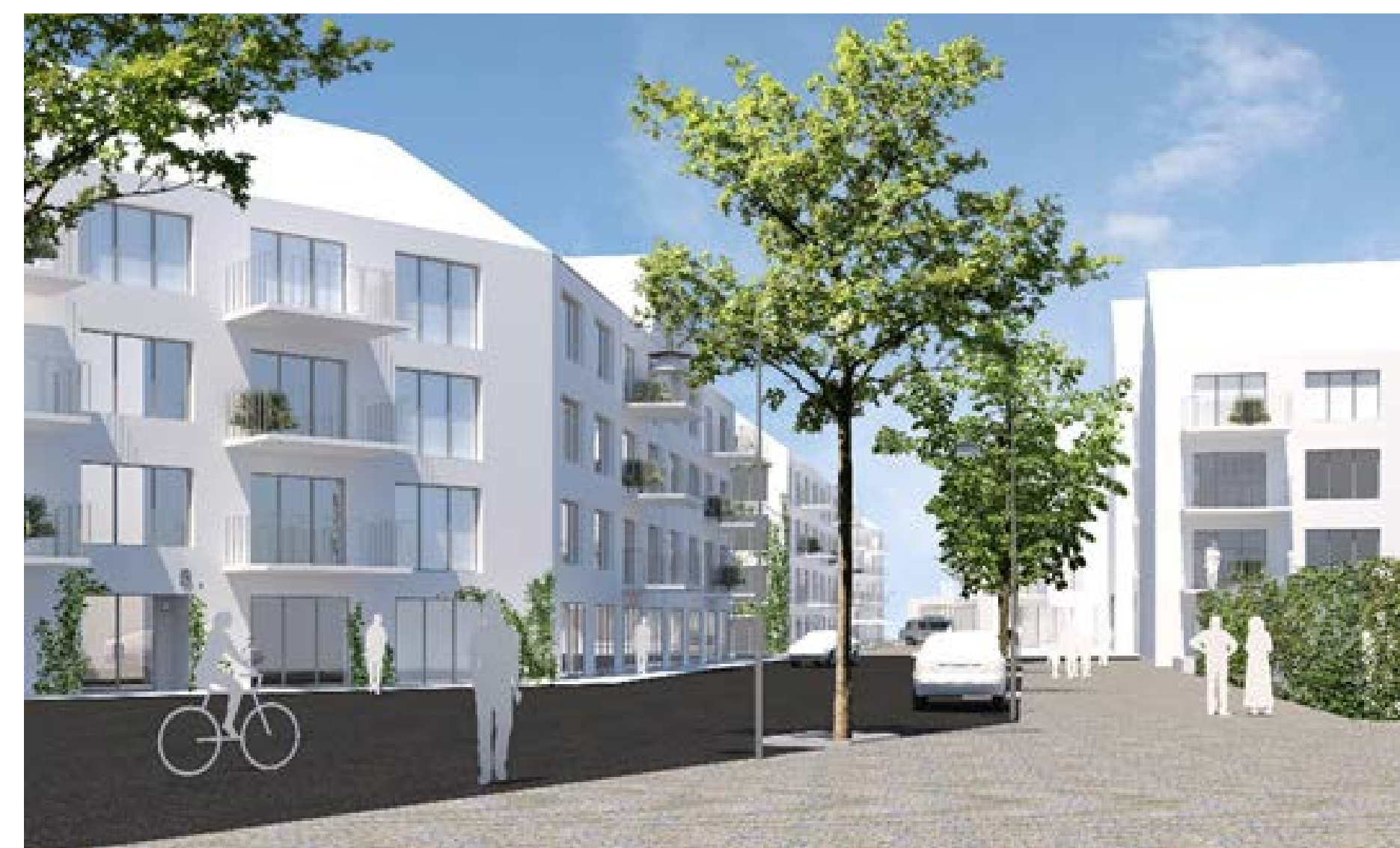
Bebyggelse och gatumiljö i kvarteren nordväst, illustration White Arkitekter