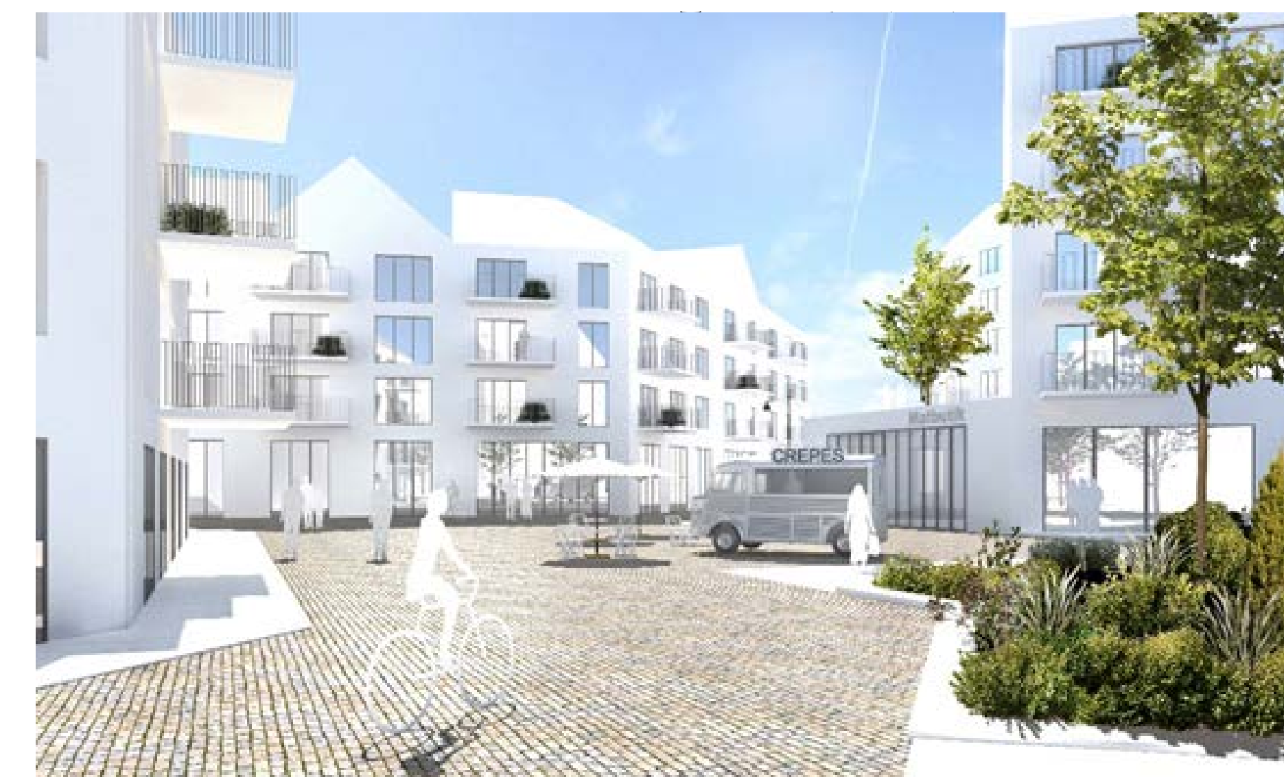
Torgmiljö, bebyggelse med livsmedelsbutik och den lokala fiskbutiken, illustration White Arkitekter.