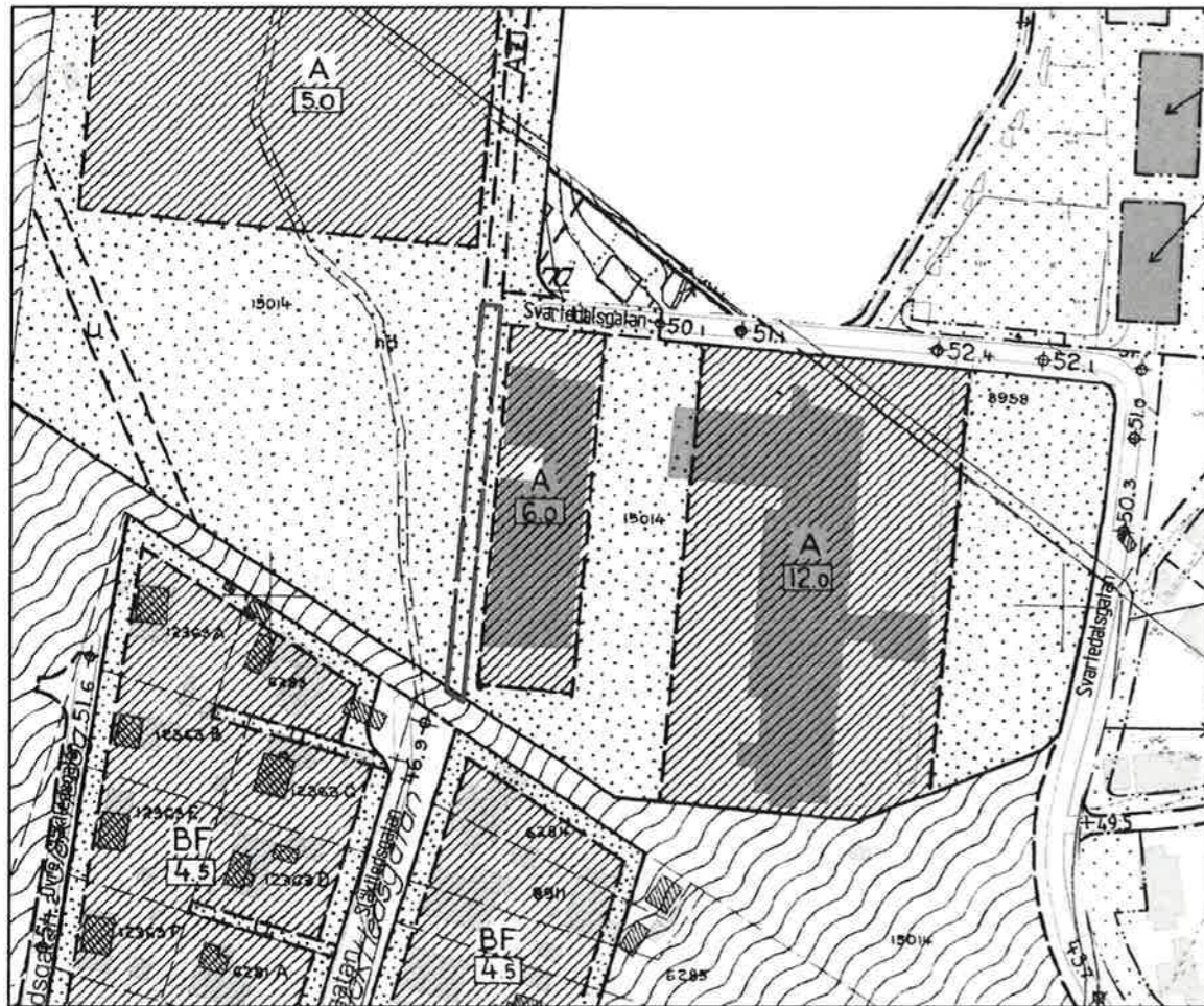
Del av detaljplan II-3133