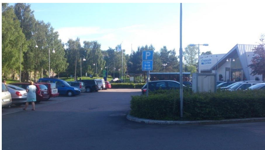
Figur 3. Parkering vid hållplats Rymdtoget Buss

Ytterligare en parkering som rymmer 34 platser varav en handikapplats finns vid busshållplatsen Rymdtoget Buss. Parkering tilläts i en timme mellan kl 8 och 18 under vardagar och lördagar, övrig tid fri parkering. På handikapplatsen tilläts parkering i 4 timmar.