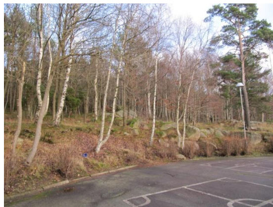
Blandskog i område 2.