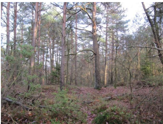
Tall/ekskog i område 4.

Område 2 och 3 har utpekats som värdefulla miljöer för mindre hackspett. Här bör inga åtgärder ske som kan äventyra hackspettsmiljön. I område 4 bör hänsyn visas till de grova tallarna.