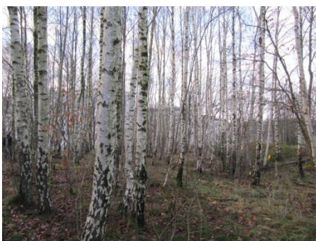
Björkskog i område 2.

Hela det inventerade området utgör en varierad och sannolikt värdefull miljö för flera arter. Bl.a. har område 1, 4 och 5 pekats ut som viktiga födosöksområden för mindre hackspett. Särskilt värdefulla är de grova ekarna på sydslutningen.