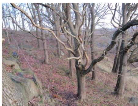
Grova ekar i område 5.