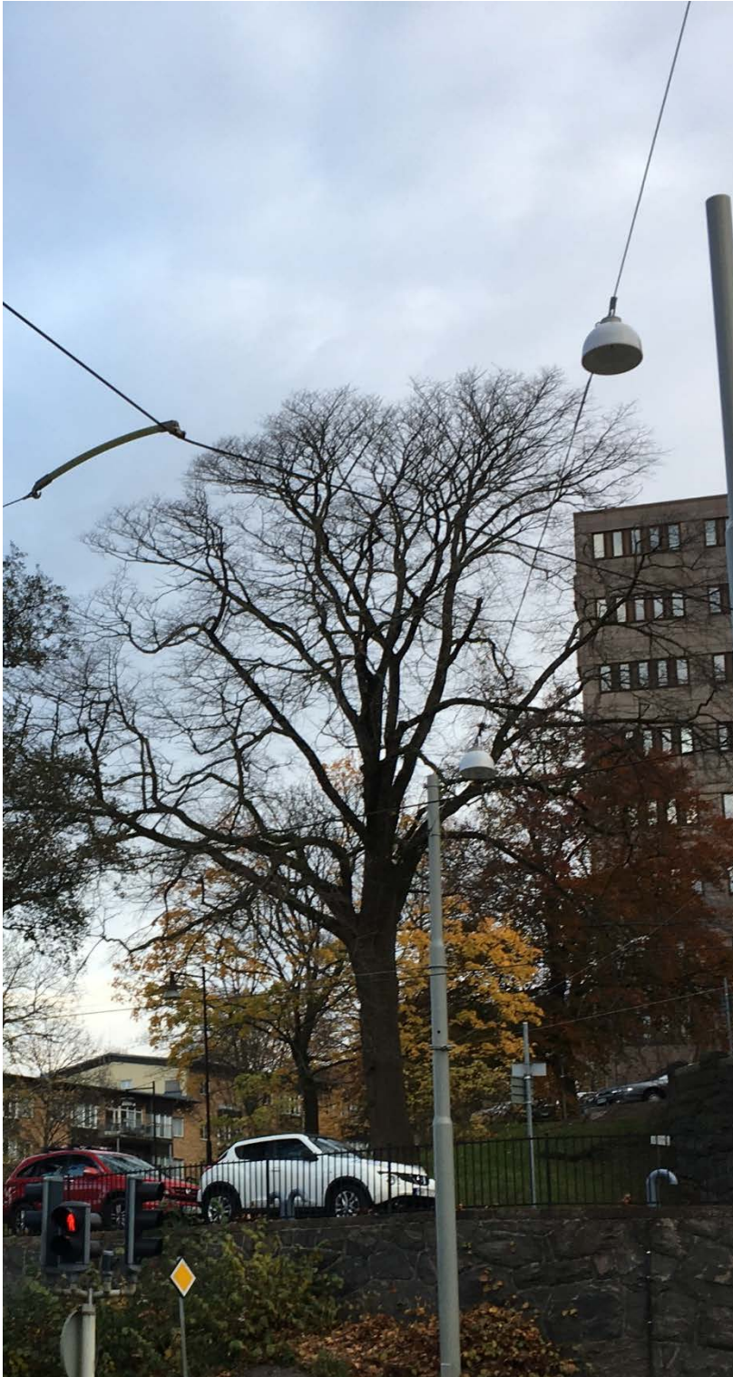
Den rödlistade jättealmen.