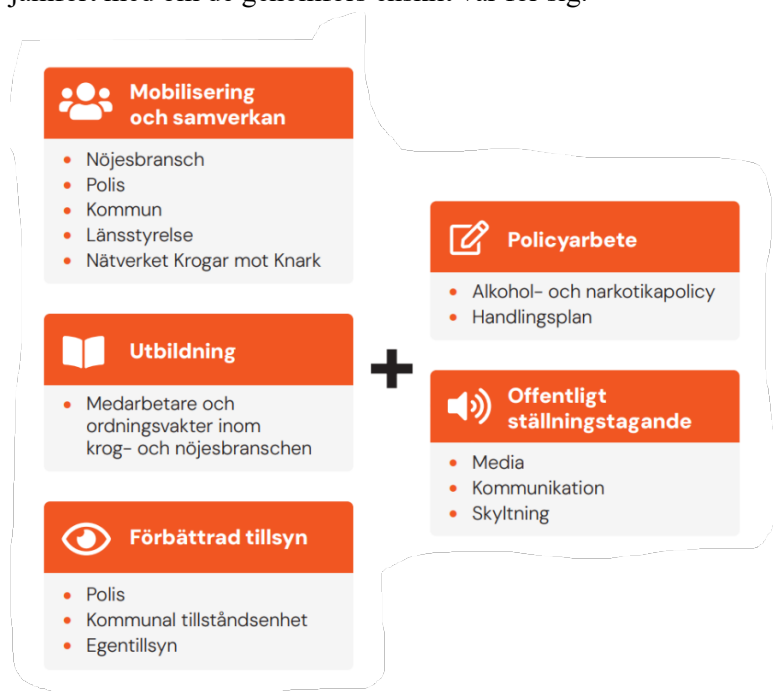
Figur 1 Beskrivning av modellen Krogar mot knarks fem komponenter

Modellen har fem komponenter och grundar sig i lokalt förebyggande arbete med vetenskaplig utgångspunkt i systemteori. Det innebär att metodens insatser sker parallellt på flera nivåer i samhället och i samverkan med nyckelaktörer och myndigheter. Avsikten är att de olika åtgärderna ska förstärka varandra och tillsammans skapa en större effekt jämfört med om de genomförs enskilt var för sig.