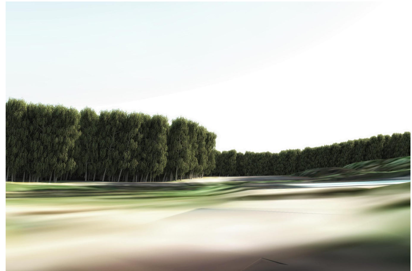
Vy från badplatsen, träden har i modellen en höjd av 15 meter.