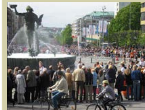
Götaplatsen fylls av folk vid fest, evenemang och demonstrationer. Här det årligen återkommande Göteborgsvarvet, en folkfest för hela staden.

En av de saker som karakteriserar en stad är variationen i offentliga och halvoffentliga rum. Det offentliga livet och de offentliga miljöerna i en stad spelar en viktig roll i stadens attraktivitet. En viktig del i arbetet med stadens utveckling är bla att beskriva och förtydliga stadens olika platser och torg och förhålla sig till de förväntningar och anspråk som finns. Göteborg är en stor stad med många offentliga rum som fyller olika behov och har olika utseende.