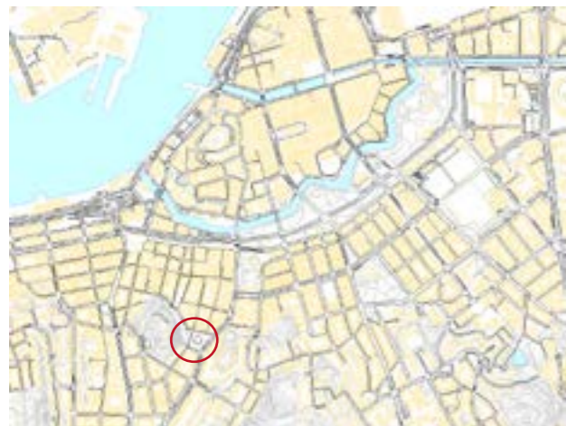
Programområdet ligger utanför Vallgraven i södra delen av Haga