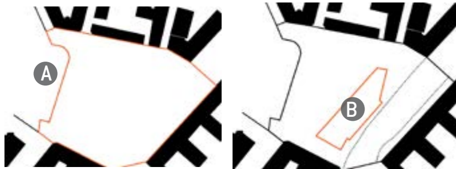
Planskisser: Principer för placering av byggnadsvolymer och utformning av stadsrummet