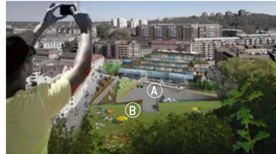
Fotomontage: Skanstorget från Skansberget

Skanstorget är en av entrépunkterna till Skansberget och det är viktigt att förstärka denna funktion. Torgets utformning måste på ett tydligt vis hantera både mötet med Skansberget och fasaderna från olika tidsepoker som utgör torgets väggar. Skansbergets grönska fortsätter och bli en del av torget gestaltning - en tydlig grön karaktär där sittbänkar och odlingsbäddar tar upp höjdskillnader. En medvetet utformad belysning är avgörande för upplevelsen av trygghet och är ett sätt att binda samman torget med Skansen Kronan och dess kringtytor.