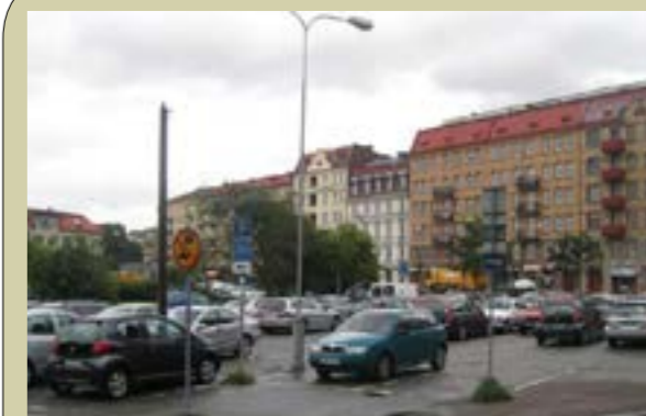
Idag: Parkerade bilar fyller Skanstorget och omkringliggande gator.

I det fortsatta arbetet efter programmet kommer utformningen av både bebyggnad och torg att behöva studeras vidare och fördjupas genom sk parallella arkitektupdrag eller en arkitektävling.