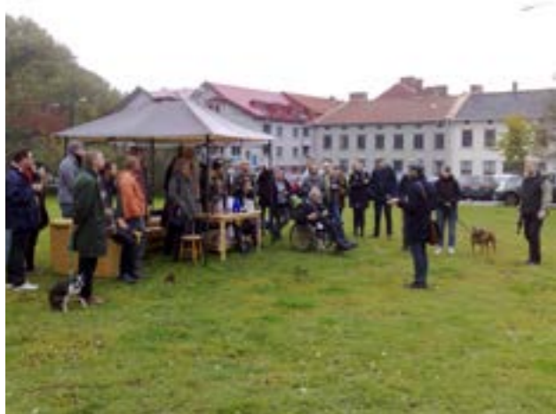
”Stadssittning” på Skanstorget

Genom utredningar, kartavläsning och workshoparbete, med personer som är verksamma i området, samlas information som struktureras under aspekterna Sammanhållen stad , Samspel , Vardagsliv och Identitet . Materialet analyseras sedan för de olika nivåerna Byggnad och Plats , Närmiljö , Stadsdel , Stad och Region . I analysarbetet för Skanstorget användes även material från en sk. ”stadssittning” som arrangerades av Stads-museet på själva Skanstorget.