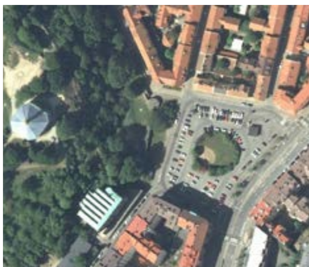
Skanstorget, nuvarande utseende