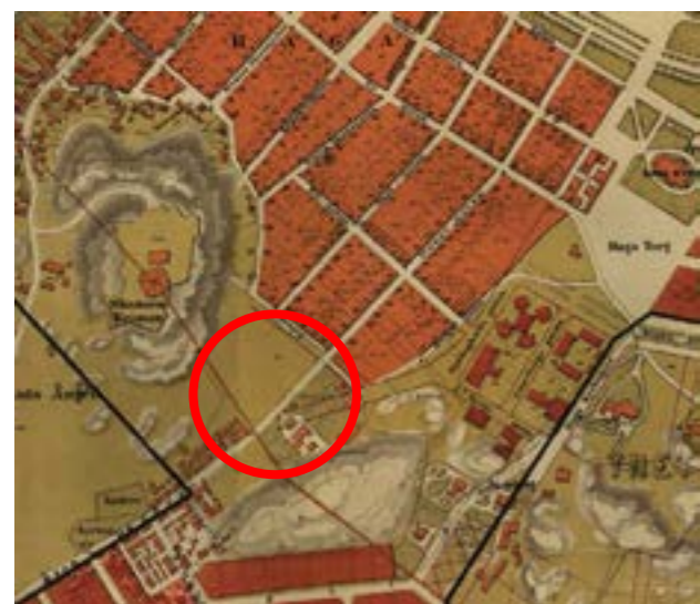
På en karta från 1872 kan man se det blivande Skanstorget med omnejd.