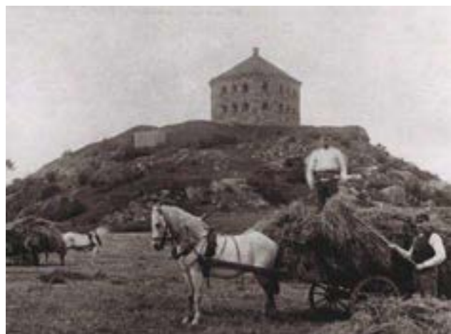
Bilden illustrerar Kommendantsängens funktion som slätteräng. Den är tagen 1896, ungefär på platsen som skulle bli Skanstorget. Området var landsbygd och användes under lång tid i jordbruket.

Skansberget väster om programområdet utgör fornlämningsområde och Skansen Kronan utgör fast fornlämning. Torgytan ligger inom influensområde för fornlämningarna men på själva torget finns inga registrerade lämningar. Terrassmuren väster om torget är uppförd i början av 1900-talet.