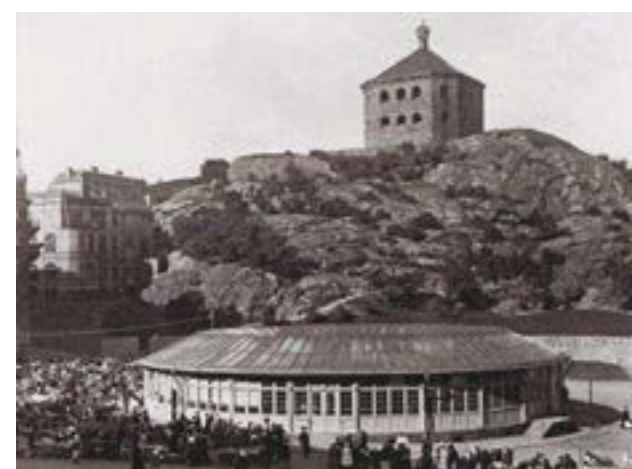
Bilden visar Skanstorget med torghandel och saluhall, ca 1920. Grönska börjar komma på Skansberget. Korsettfabriken syns till vänster i bild