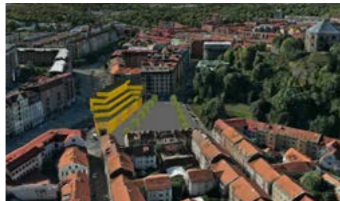
Volymstudie: Skanstorget från norr

D Skansbergets grönska präglar utformningen av torget som inriktas på att stärka rumsligheten och upplevelsen av ett sammanhängande torg med de historiska gränserna som ram.