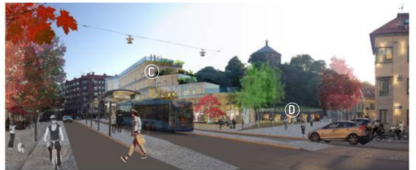
Fotomontage: Skanstorget från Sprängkullsgatan

D Lokaler under terrassen vid Skansbergets fot kan ge ytterligare målpunkter och bidra till aktivitet på torgets västra del och till att stärka stråket över torget