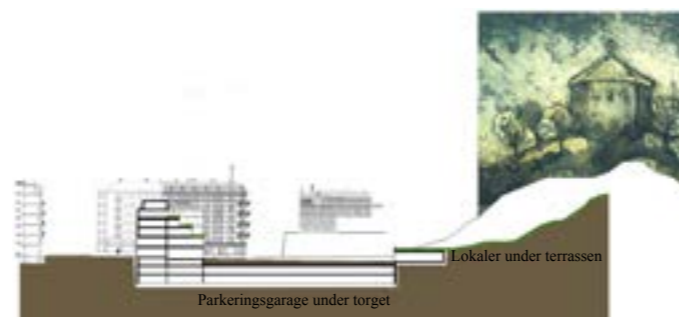
Sektion: Skanstorget från norr med underjordiskt garage

Skanstorget har stor potential att bli en mötesplats, beläget på ett stråk som utvecklas mellan Vasagatans västra del och Linnéområdet. I stadsdelen finns få soliga, öppna och plana aktivitetsytor. Platsen har därför stor betydelse för stadsdelen med viktiga kvaliteter att bevara och utveckla.